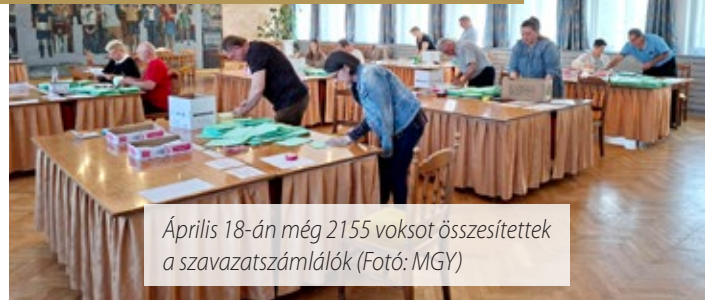
prilis 18-n mg 2155 voksot sszestettek a szavazatszmllk (Fot: MGY)

Csnyejmajorban 31 szavazatot adtak le, ezeknek a darabszmt is ellenrztk az urna kibontsakor. Az 5-s szm