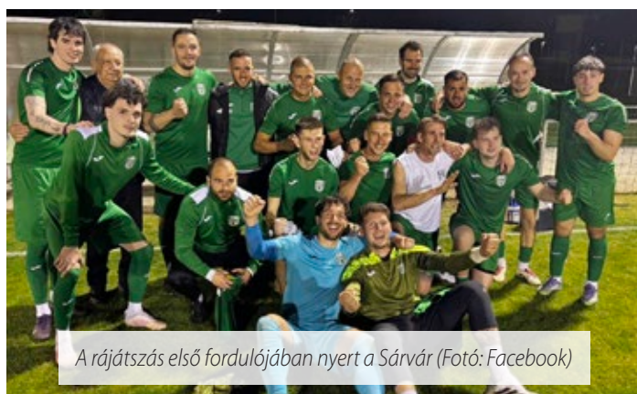
A rájátszás első fordulójában nyert a Sárvár

Minden szurkolót várnak a mérkőzésekre, a záró három forduló hazai pályán kerül megrendezésre: május 8-án a Haladás, május 16-án a Szarvaskend, május 23-án a Király SE lesz az ellenfél. A mérkőzések 17:30-kor kezdődnek.