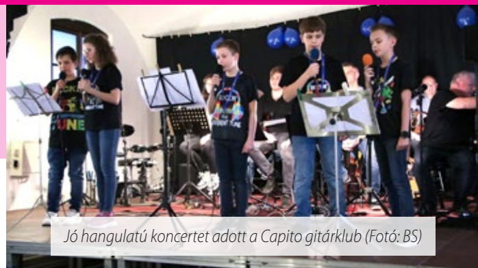
Jó hangulatú koncertet adott a Capito gitárklub

–Több mint húsz éve miszióm, hogy autizmus-spektrumzavarral élő gyerekeknek és családjaiknak segítsék. Pszichológiai és ABA-terápiás tanulmányaimat,