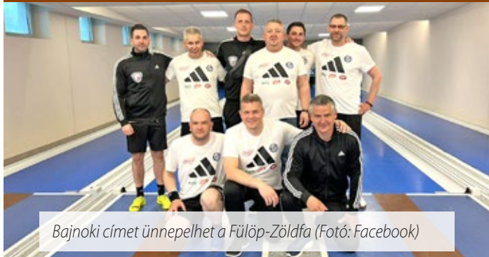
Bajnoki címet ünnepelhet a Fülöp-Zöldfa

A bajnokság vége előtt két fordulóval bebiztosította elsőségét az NB I-es tekebajnokság Nyugati csoportjában a Fülöp Borzóz & Zöldfa Italker TSE.