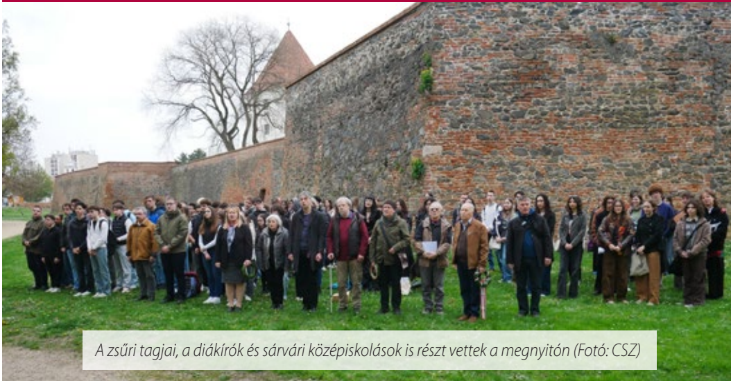
A zsűri tagjai, a diákírók és sárvári középiskolások is részt vettek a megnyitón

Idén tavasszal is összegyűltek és bemutatkoztak az ifjú irodalmárok Sárváron. Az Írók Alapítványa, az Írók Szakszervezete, a Sárvári Tinódi Gimnázium és Sárvár Város Önkormányzata 49. alkalommal hirdette meg a Kárpát-medencei Középiskolás Irodalmi Pályázatot, és megszervezte az alkotótábort.