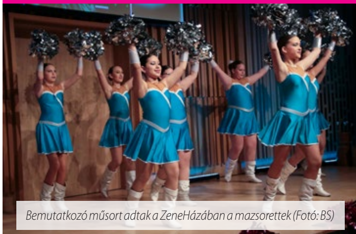
Bemutató műsort adtak a ZeneHázában a mazsorett

A Magyar Fúvószenesi és Mazsorett Szövetség márciusi közgyűlésén a Sárvár Városi Mazsorett Együttes két jelentős szakmai elismerésben részesült.