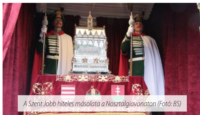
A Szent Jobb hiteles másolata a Nosztalgia vonaton