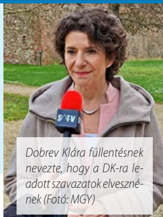
Dobrev Klára füllentésnek nevezte, hogy a DK-ra leadott szavazatok elvesznének

A Demokratikus Koalíció elnöke, Dobrev Klára március 30-án látogatott Vas vármegyébe, járt Celldömölkön, Szombathelyen és Sárváron is. A párt listavezetőjét az országgyűlési választás tétjéről, és arról is kérdeztük, hogy nem vesznek-e el a DK-ra leadott szavazatok.