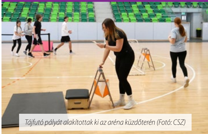
Tájfutó pályát alakítottak ki az aréna küzdőterén

Tizenharmadik alkalommal rendezte meg a Sárvári Teremtájfutó Bajnokságot a Sárvári Kinizsi SE Tájfutó Szakosztálya. Március 11-én több mint 200 diák ismerkedhetett meg a sportággal a Sárvár Arénában. Ez volt a hivatalos nyitánya a Mozdulj Sárvár! egészséges életmódot népszerűsítő programsorozat 2026-os idényének.