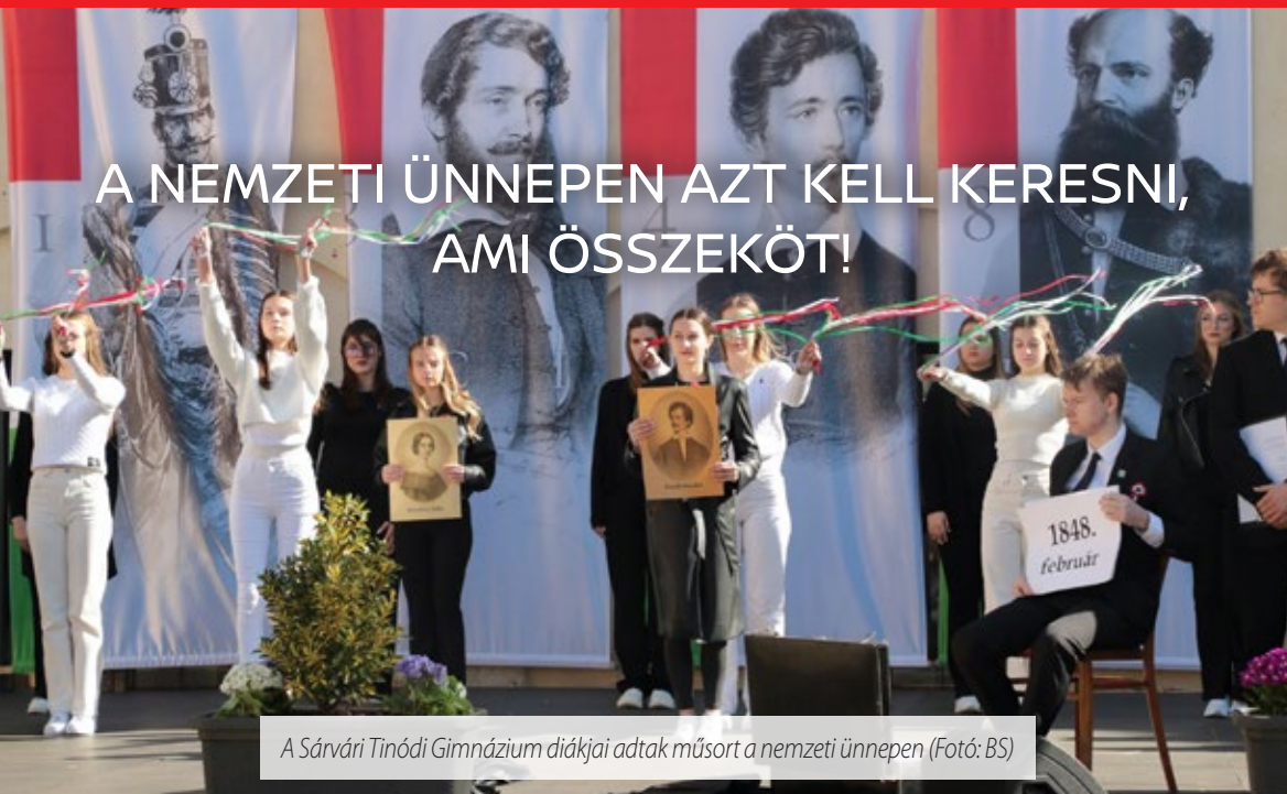
A Sárvári Tinódi Gimnázium diákjai adtak műsort a nemzeti ünnepen

Több százan gyűltek össze a Nádasdy-vár udvarán március 14-én délelőtt, hogy együtt ünnepeljenek az 1848/49-es forradalom és szabadságharc 178. évfordulóján a tavaszi napsütésben. A Himnuszt a Sárvári Koncertfúvószenekar előadásában hallhatták az ünneplők, majd az emlékező beszédet Ágh Péter országgyűlési képviselő mondta.