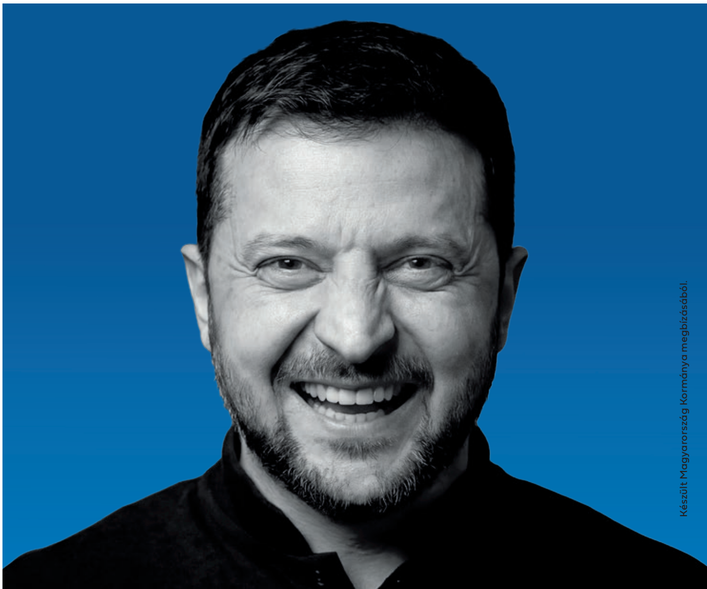
Készült Magyarország Kormányának megbízásából.