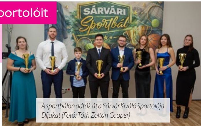
A sportbálon adták át a Sárvár Kiváló Sportolója Díjakat