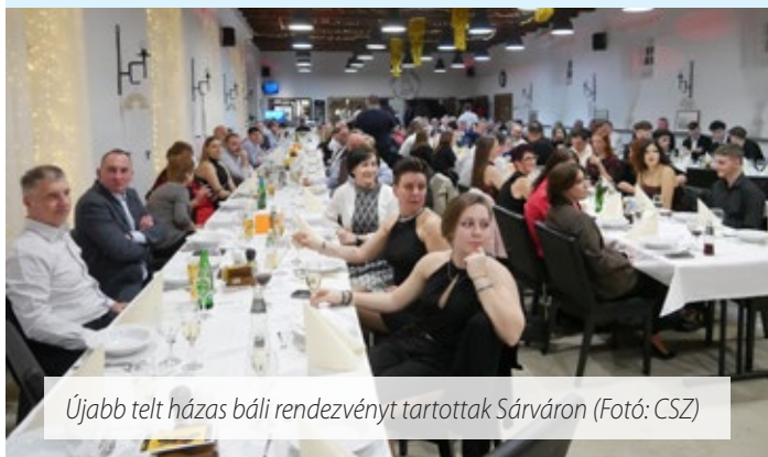
Újabb telt házас bálit rendezvényt tartottak Sárvaron

Az idei évben már 12. alkalommal tartották meg a „dübörgő bál”-ként is emlegetett Jótekonysági Motoros-Autós Bált. A két- és négykerekű járművek szerelmesei február 21-én a Vadkert Majorban találkoztak.