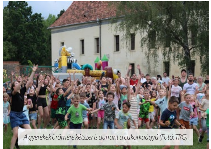
A gyerekek öröme kétszer is durrant a cukorkaágyú

A délután folyamán két időpontban is cukorkaágyú lőtte az édességeket a hátsó várudvarban. Az eső előtt megérkezett „ürlényecske”, ahogy a gyerekek elnevezték a sétáló figurát, vele együtt ugráltak, fotózkodtak a gyerekek. Az időjárás sajnos a