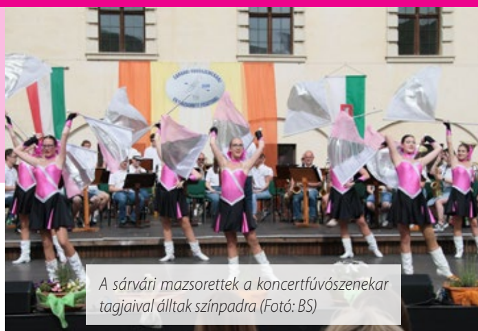
A sárvári mazsorették a koncertfúvószenekar tagjaival álltak színpadra

Majd Szabó Ferenc, a Magyar Fúvószenekari és Mazsorett Szövetség elnöke köszöntötte a fesztivál résztvevőit, köszönetet mondott a sárvári önkormányzatnak, a Sárvár Városi Mazsorett Együttesnek és a Sárvári Koncertfúvószenekarnak is, hiszen hosszú évek óta Sárvár a mazsorett és fúvószenekari egyik legnagyobb támogatója, színvonalas fesztiválok és versenyek rendezője.