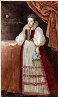
BÁTHORY ERZSÉBET MÚZEUMI SZABADULÓ JÁTÉK 15:00-19:00