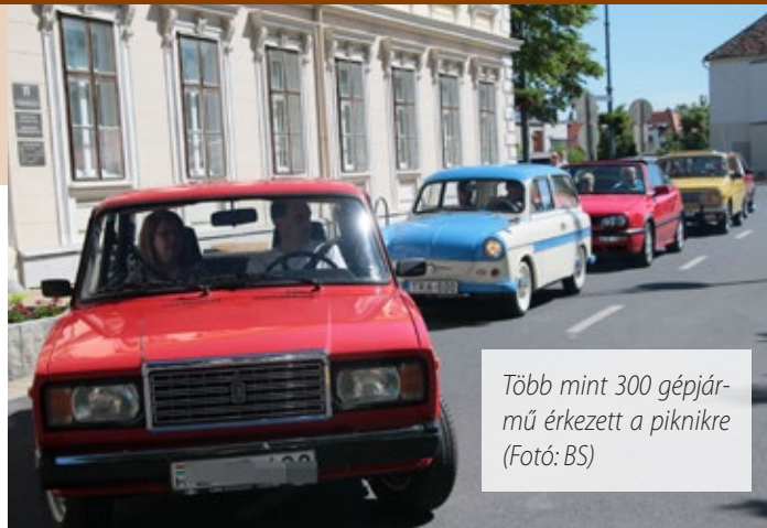
Több mint 300 gépjármű érkezett a piknikre

A kiállítók ezúttal is az ország több pontjáról érkeztek Sárvárra. A Veteránjármű Kedvelők Baráti