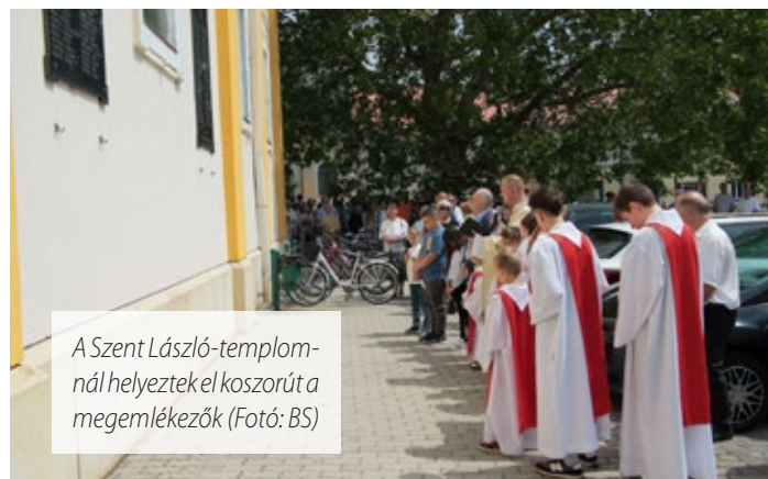
A Szent László-templomnál helyezték el koszorút a megemlékezők