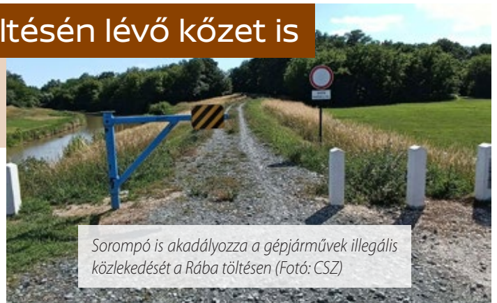
Sorompó is akadályozza a gépjárművek illegális közlekedését a Rába töltésén

Ezen körülmények között különösen fontos a közlekedés korlátozása és visszaszorítása a töltésen, ezért a rendőrségtől fokozott ellenőrzést kért a vízügyi igazgatóság az érintett helyszínrre.