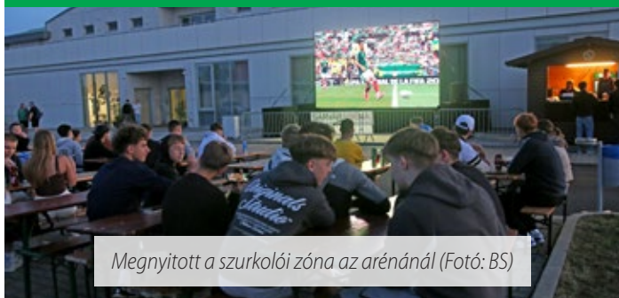
Megnyitott a szurkolói zóna az arénánál

Június 11-én elkezdődött a 2026-os labdarúgó-világbajnokság. A Sárvár Arénánál felállították a kivetítőt és a szurkolói zónát, ahol élőben lehet követni a mérkőzéseket.