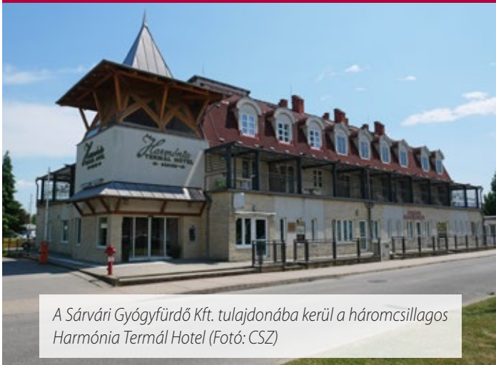
A Sárvári Gyógyfürdő Kft. tulajdonába kerül a háromcsillagos Harmónia Termál Hotel