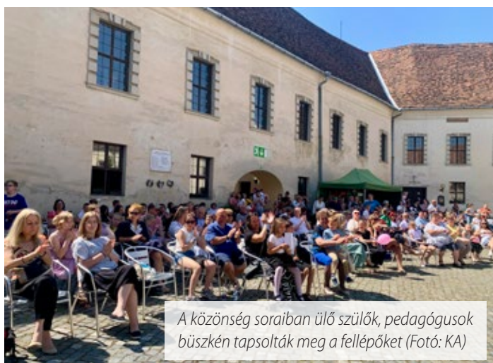
A közönség soraiban ülő szülők, pedagógusok büszkén tapsolták meg a fellépőket

a színpadon. Sokat gyakoroltatok, sokat készültetek és ez most egy jutalom nektek!” Arra biztatta a gyerekeket, hogy élvezzék ki a