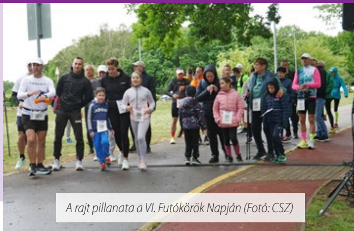
A rajt pillanata a VI. Futókörök Napján

Hatodik alkalommal került megrendezésre a Futókörök Napja, május 16-án rekordszámú helyszínen, összesen 25 rekortán borítású pályán húztak futócipőt a résztvevők. Sárvár idén is csatlakozott a programhoz, és a korábbi versenyekhez hasonlóan a TOP10-ben, a 7. helyen végzett.