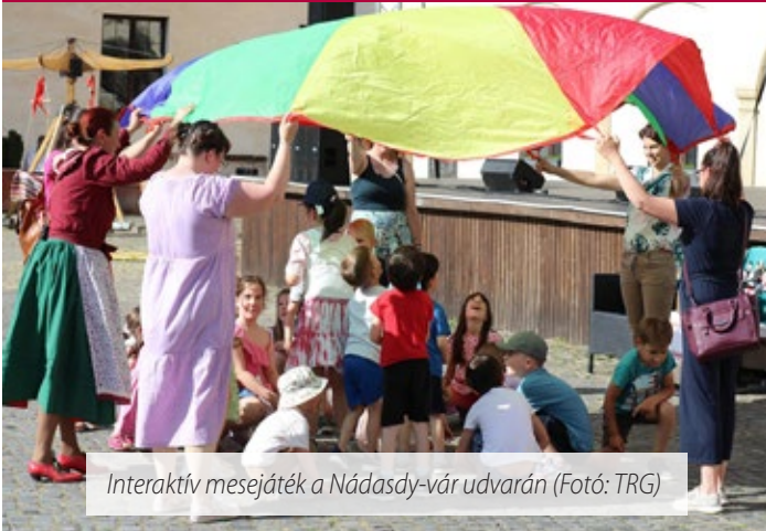
Interaktív mesejáték a Nádasy-vár udvarán

Pütkösi vigadalomra várták az érdeklődőket a Nádasy-várba május 24-én, pütkösduasárnap. A kicsiktől a nagyokig minden korosztály megtalálta az érdeklődésének megfelelő programot.