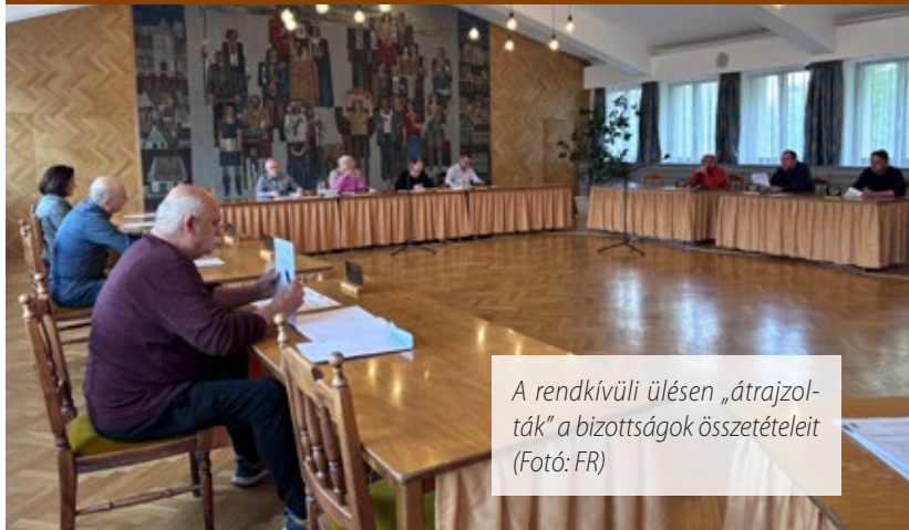
A rendkívüli ülésen „átrajzolták” a bizottságok összetételét

Rendkívüli ülést tartott május 18-án délután a sárvári képviselő-testület a Városháza nagytermében, ahol új bizottsági és FEB-tagokat választottak.