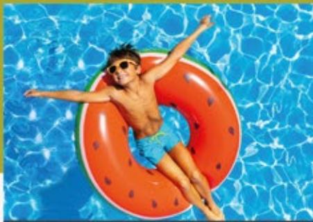
KALÓZTÁBOR (6-10 ÉVES GYERKŐCÖKNEK)