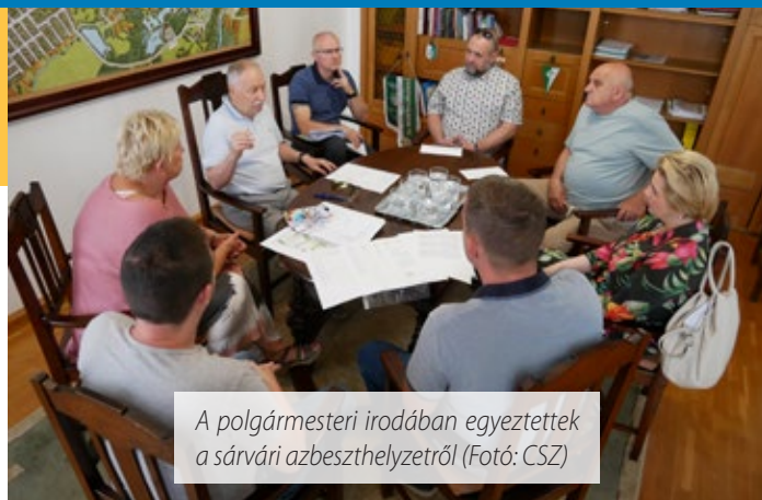
A polgármesteri irodában egyeztettek a sárvári azbeszthelyzetről