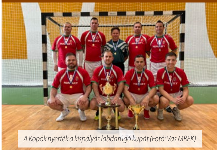
A Kópók nyerték a kispályás labdarúgó kupát

A vasi rendőrök Szent György Napi Kispályás Labdarúgó Kupát szerveztek május 22-én Sárváron, a Sárvár Arenában. A tornára 6 csapat nevezett, így közel 70 játékos lépett pályára a kiélezett mérkőzéseken.