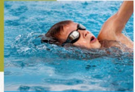
ÚSZÓTÁBOR NEMCSAK ÚSZÓKNAK