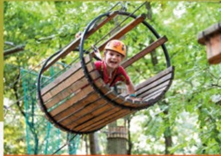
GÉZENGŰZ TÁBOR (8-12 ÉVES GÉZENGŰZOKNAK)