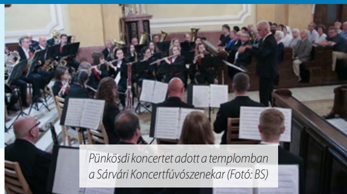
Pütkösi koncertet adott a templomban a Sárközi Koncertfúvószenekar

– Olyan műveket válogattunk össze, amelyek ünnepélyesebbek, tartalmasabbak és nagyobb