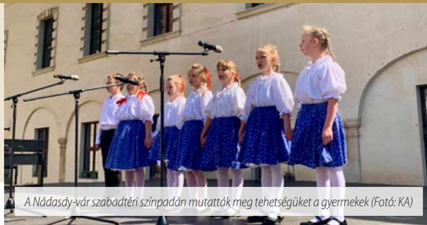
A Nádasy-vár szabadtéri színpadán mutatták meg tehetségüket a gyermekek

Pünkösdhétfőn, május 25-én délelőtt gyönyörű, napsütésben tartották a város és környéke általános iskoláinak meghirdetett Sárvári Kulturális Seregszemle gálaműsorát a Nádasy-vár szabadtéri színpadán. Négy napon át tartott az előválogató, a szakmai zsűri végül összesen 34 produkciónak ítelt kiemelt arany minősítést, akik ünnepélyes keretek között, szülőknak, pedagógusoknak, társaiknak mutathatták meg tehetségüket vers, verses mese, népdal és modern dal kategóriákban.