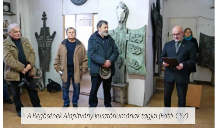
A Regösének Alapítvány kuratóriumának tagjai