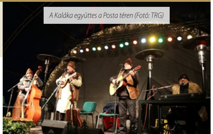
A Kaláka együttes a Posta téren