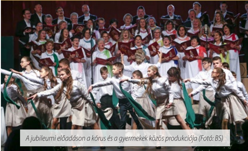
A jubileumi előadáson a kórus és a gyermekek közös produkciója

Az idén 10 éves Sárvári Oratórikus Kórus, gyerekkórusa és tánckara (SOK) „10 év mögöttünk, sok terv előttünk” jubileumi programsorozatának lezárásaként telt házas koncertet adott november 25-én a Sárvár Arénában.