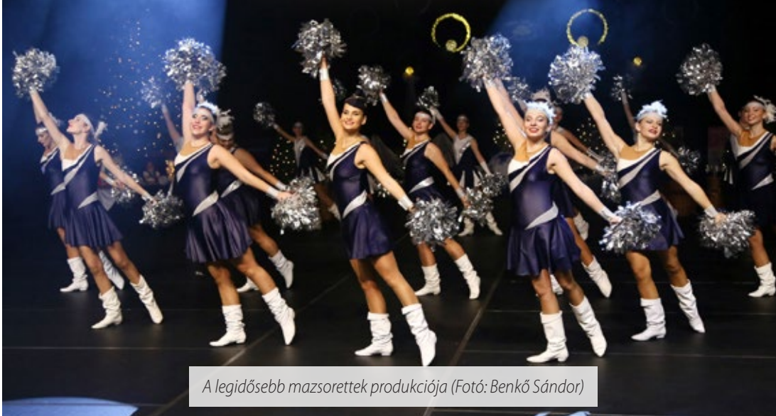
A legidősebb mazsorettek produkciója

A Sárvár Városi Mazsorett Együttes telt házas, nagy sikerű gálát adott a Sárvár Arénában. A műsorban valamennyi csoport fellépett, és az idén 25 éves Kanona Band is közreműködött.