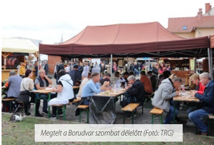
Megtelt a Borudvar szombat délelőtt