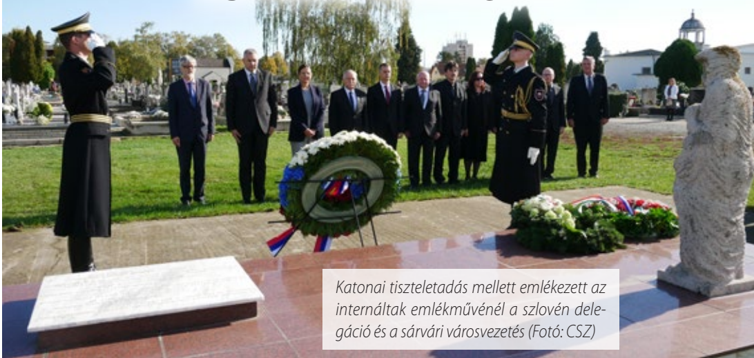
Katonai tiszteletadás mellett emlékezett az internáltak emlékművénél a szlovén delegáció és a sárvári városvezetés

Halottak napja közeledtével hivatalos szlovén delegáció érkezett városunkba, hogy Sárvár Város Önkormányzatával együtt megemlékezzen a II. világháború alatt Sárvárra, az egykori internálótáborba elhurcolt szlovén áldozatokról.