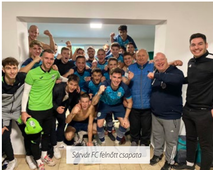
Sárvár FC felnőtt csapata

A Vas vármegyei I. osztályú labdarúgó-bajnokság 12. fordulójában, november 4-én a Sárvár 7–0-ra győzte le a Büköt.