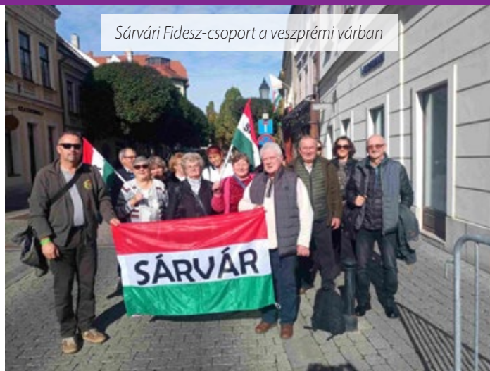
Sárvári Fidesz-csoport a veszprémi várban