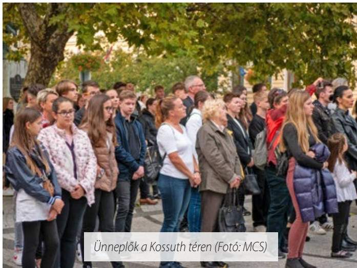
Ünnepelők a Kossuth téren

tizenkét napon át lobogott és melyet – ahogy 1849 nyarán, úgy mint 1956 őszén – újra csak idegen erők, a keleti nagy biroda-