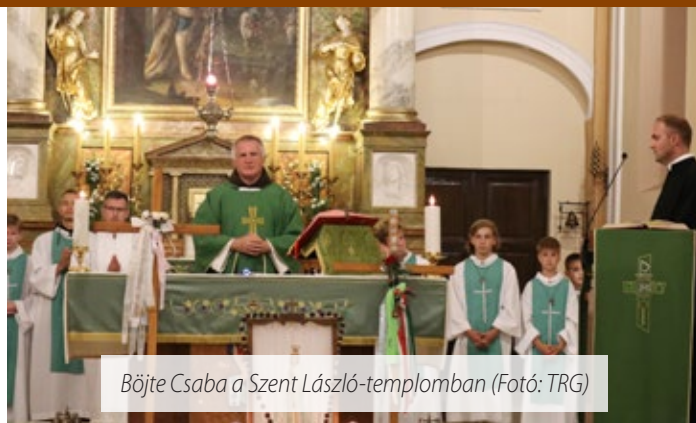
Bójte Csaba a Szent László-templomban

Bójte Csaba elmondta, hogy nagy örömmel érkezett újra Sárvárra. Október a Szűzanya hónapja, és felemelő volt számára, hogy a hónap első napján egy zárandoklat keretében imádkozhatott a sárvári hívekkel együtt Szűz Máriához. A prédikációban Csaba testvér szólott arról, hogy merjünk küzdeni saját magunkért, ne sodródjunk az árral, hiszen Isten mindannyiunkhoz szól, minden nap. A mai ember sokszor problémákkal szembesül, de ne feledjük, az élet nehézségekkel jár, és nem csak napjainkban volt ez így, hanem 2000 évvel ezelőtt is. Nem mindig kipárnázott az élet, tenni kell azért, hogy megéljük a mindennapjainkat, és tenni kell azért is, hogy teljesíteni tudjuk Isten akaratát. Szűz Mária és József