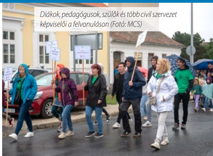
Diákok, pedagógusok, szülők és több civil szervezet képviselői a felvonuláson

A felvonulás után a Sárvári Tinódi Gimnázium dísztermében folytatódott a programok. Kertészeti szaktanácsadással, mézkostolóval,