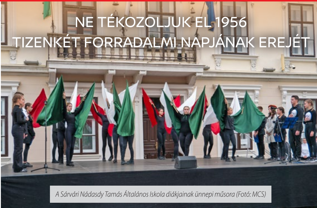
A Sárvári Nádasy Tamás Általános Iskola diákjainak ünnepi műsora