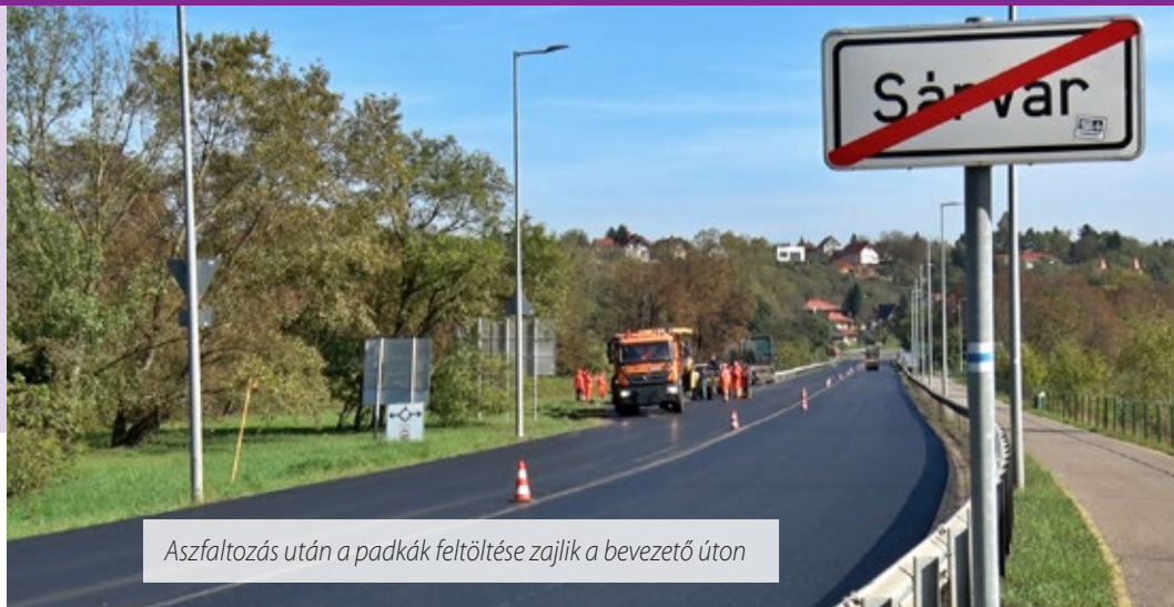
Aszfaltozás után a padkák feltöltése zajlik a bevezető úton

Elkészült határidőre a Sárvarra bevezető út sótonyi kereszteződés és TESCO-körforgalom közötti 600 méteres szakaszának aszfaltozása, és október 13-án kora reggel meg is nyitották a közlekedők előtt. A megújult utat sebességkorlátozás mellett használhatják a gépjárművezetők.