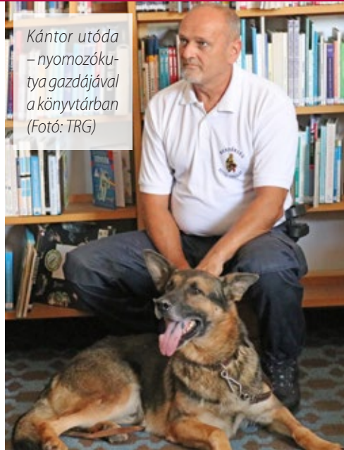
Kántor utóda – nyomozókutyát gazdájával a könyvtárban

A Zenei klubban megemlékeztek Brahms születésének 190. évfordulójáról. A sárvári könyvtár az Országos Könyvtári Napok keretein belül könyvszigeteket helyezt ki a város két intézmé-