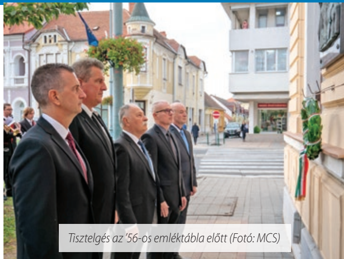
Tisztelgés az '56-os emléktábla előtt

lom, Oroszország, a Szovjetunió sötét hadserege tudta eloltani. A megtorlás, mint alig száz évvel korábban, akkor sem maradt el, mértéke most sem ismert határokat. Országszerte mártírok sora jelzőfényként mutatják, hogy a tizenkét nap hogyan fogta össze