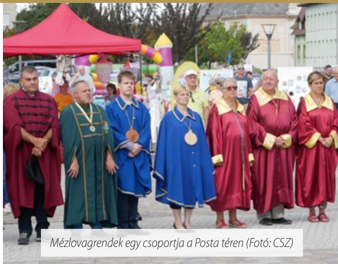
Mészlovagrendek egy csoportja a Posta téren

A mézkirálynők rendszeres vendégei a sárvári méhésznapi napoknak. Ez idén sem volt másként.