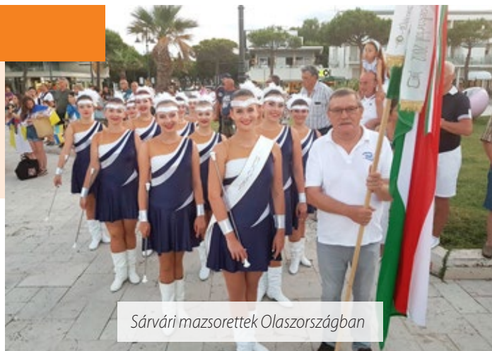
Sárvári mazsorettok Olaszországban

Az idei nyár kiemelkedő programja volt az olaszországi utazásunk. Július elején a Nemzetközi Összművészeti Fesztiválra utaztunk Cesenatico–Riminibe. Nagy izgalommal készültünk az útra, ahová a Felöltt, a Kristály és a Rózsaszínpárduc Csoportból alkotott csapat és vállalkozó szülők utaztak.