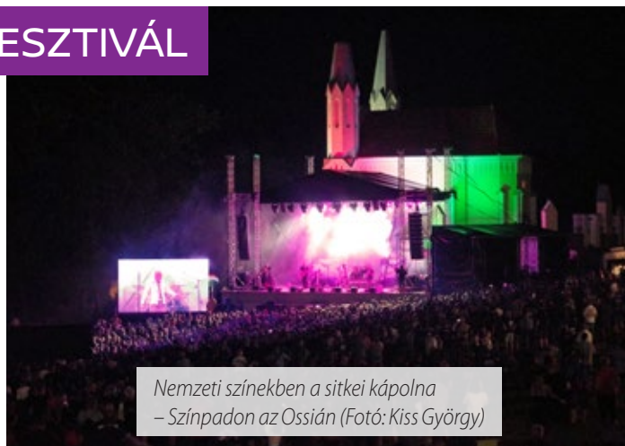
Nemzeti színekben a sitkei kápolna – Színpadon az Ossian

A koszorúzás után a Mobilmánia zenélt. Az együttes alapító és örökös tagjával, Vikidál Gyulával