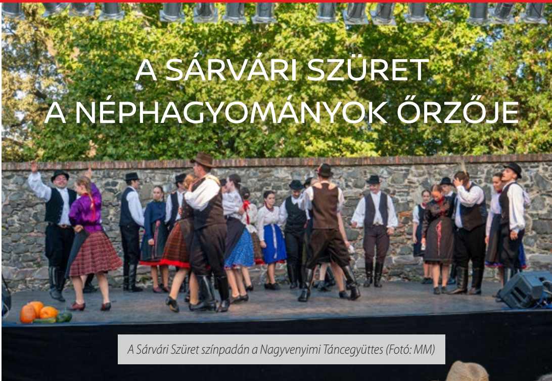
A Sárvári Szüret színpadán a Nagyvenyimi Táncegyüttes

Szeptember 9-én szervezték meg a Sárvári Szüret programját a Nádasdy-vár hátsó udvarában. A szüret előestéjén már a Jurta zenekar táncháza hívogatta az érdeklődőket, szombat délután pedig egymás után sorjázta a néptáncbemutatók a színpadon, ahol Dr. Máhr Tivadar alpolgármester nyitotta meg a programot.