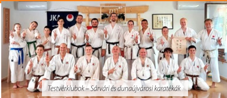
Testvérklubok – Sárvári és dunaújvárosi karatékák

A Sárvári Shotokan Karate Egyesület minden évben olyan edzőtábort is szervez, melyen a csapat tagjaival együtt közvetlen hozzátartozók is részt vehetnek. A napi tréningek és foglalkozások mellett a környéket is felfedezik, és megnézik a látnivalókat is, idén a Királyrétre esett a választás.