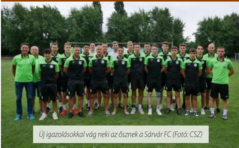
Új igazolásokkal vág neki az ősznek a Sárvár FC

A Sárvár FC Sporttelepén a felnőtt csapat is megtartotta szezonnyitó sajtótájékoztatóját. A gárda a Vas Vármegyei I. osztályban szerepel a 2023/2024-es szezonban, és nevezett a Halmosi Zoltán Vas Vármegyei Kupába is. A célkitűzés az, hogy a bajnokságot az első három hely egyikén zárja. A tájékoztatón az új igazolások is bemutatkoztak.