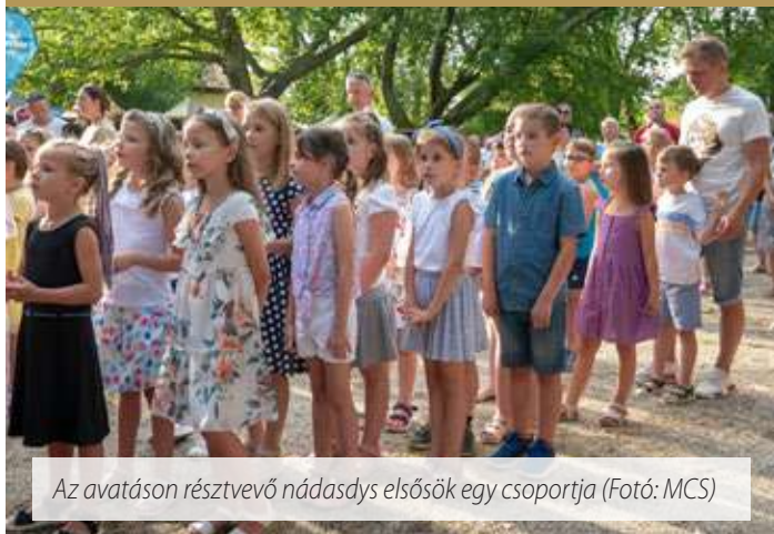
Az avatáson résztvevő nádasdys elsősk egy csoportja