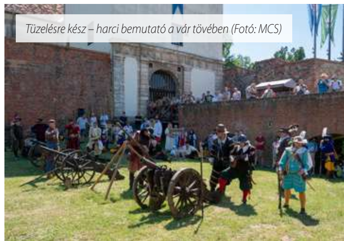
Tüzelésre kész – harci bemutató a vár tövében

Július 14-én és 15-én estére is elhallgattak a fegyverek, hogy aztán a zenéjé legyen a főszerep. A régi és világzenei dallamok mellett nagy sikert aratott pénteken a Partyssimó, szombaton pedig a Konyha zenekar. A Nádasdy Fesztivál vasárnap délből zárult, hogy aztán ismét egy évet várjunk arra, hogy szélesre táruljon a történelem kapuja. -fr-