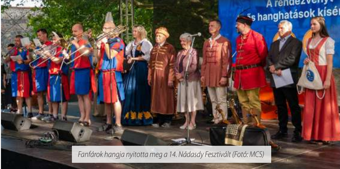
Fanfárok hangja nyitotta meg a 14. Nádasy Fesztivált

Három napra kitérte a történelem kapuja Sárváron! Július 14-e és 16-a között szervezték meg a 14. Nádasy Fesztivált. A nyitónapon került sor a felvonulásra és a Nádasy iskola első osztályosainak avatására.