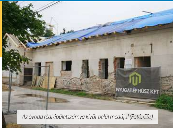
Az óvoda régi épületszárnya kívül-belül megújul

– Néhány hónapja kezdtük el a Szatmár utcai óvoda bővítését, megszerkesztését. Én azt látom, hogy a gyermekintézményeink – a bölcsőde és az óvodai telephelyek – felújítása ezzel 90 százalék fölél érkezik. Egyetlen egy kis