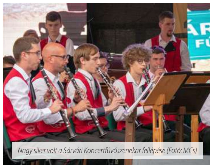
Nagy siker volt a Sárvári Koncertfúvószenekear fellépése

nél nagyobb nyilvánosság előtti bemutatkozást és a repertoár folyamatos bővítését. A zenekar több évben is megmérettette magát, 2006-ban „B” fokozaton, majd 2011-ben és legutóbb 2020 februárjában is „C” fokozaton koncert és szórakoztató kategóriában kiemelt arany minősítést kapott a MAFUMASZ zsűrijétől. A zenekart alapította és a kezdetek-