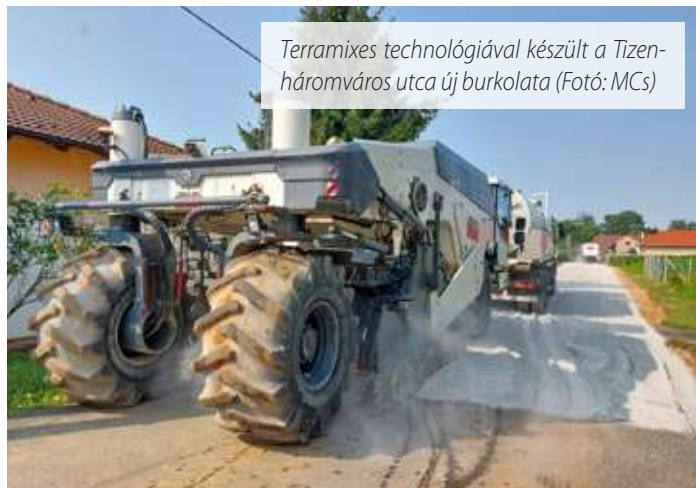
Terramixes technológiával készült a Tizenháromváros utca új burkolata