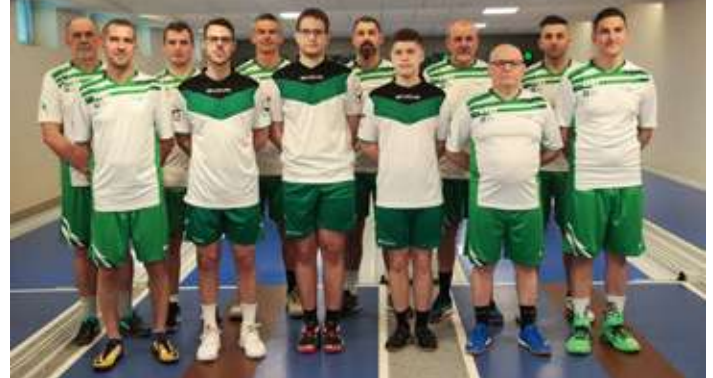
A 8. helyen végeztek NB I-es tekecsapatunk

ami azt jelenti, hogy a 7-8. helyért a Csákánydoroszlóval mérkőztünk. Az utolsó pár gurítás nem úgy jött ki, ahogy terveztük, így a 2022/2023-as bajnoki szezont a 8. helyen fejeztük be. Az ifjúsági játékosok ezzel az