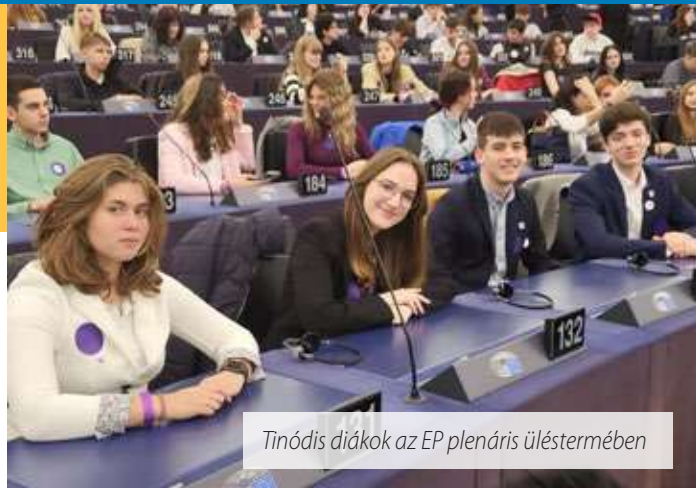
Tinódis diákok az EP plenáris üléstermében

Késő délután mindenkinek lehetősége volt ismerkedni magával Strasbourggal: megnéztük a híres székesegyházat és a La Petit Venise elnevezésű óvárost is a város folyója partján. Este folytattuk