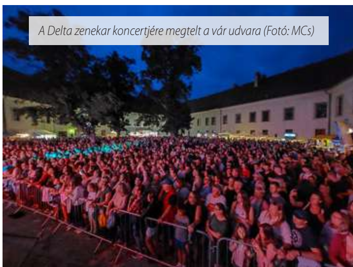
A Delta zenekar koncertjére megtelt a vár udvara