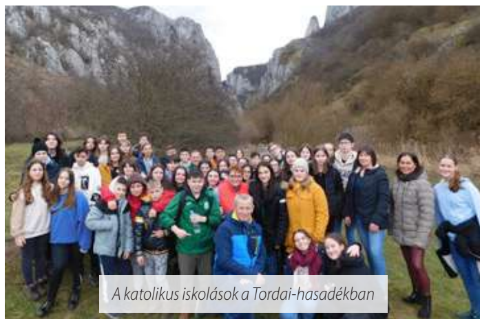
A katolikus iskolások a Tordai-hasadékban

dai-hasadékhoz, Erdély egyik legismertebb, legnépszerűbb kirándulóhelyéhez köthető. A szurdokban futó, függőhidakkal