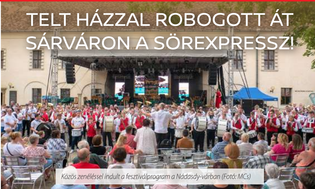
Közös zenéléssel indult a fesztiválprogram a Nádasy-várban (Fotó: M Cs)

A Sárvári Sörexpressz és 23. Fúvószenei Várfesztivál rendezvényével folytatódott a sárvári fesztiválok sora június 30-án és július 1-jén. Az idei évben négy fúvószenekar lépett fel a rendezvényen, a könnyűzenei programok pénteken és szombaton este is megtöltötték a Nádasy-vár udvarát.