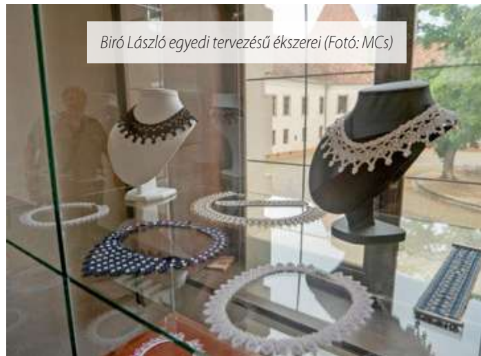
Bíró László egyedi tervezésű ékszerei