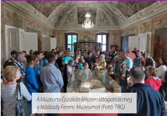
A Múzeumi Éjszakán félezen látogatták meg a Nádasdy Ferenc Múzeumot

Az idei évben is nagy sikerrel rendezte meg a Nádasdy Kulturális Központ június 24-én, Szent Iván-napján a Múzeumi Éjszaka programjait a Nádasdy Ferenc Múzeumban és a Nádasdy-vár udvarán a Szent Iván-éji műsorokat.