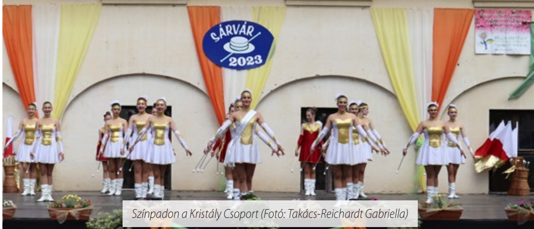
Színpadon a Kristály Csoport

Fantasztikus hangulatban indult el június első hétvégéjén a fesztiválszezon a XIII. Sárvári Országos Mazsorett Fesztivállal a Nádasy-várban.