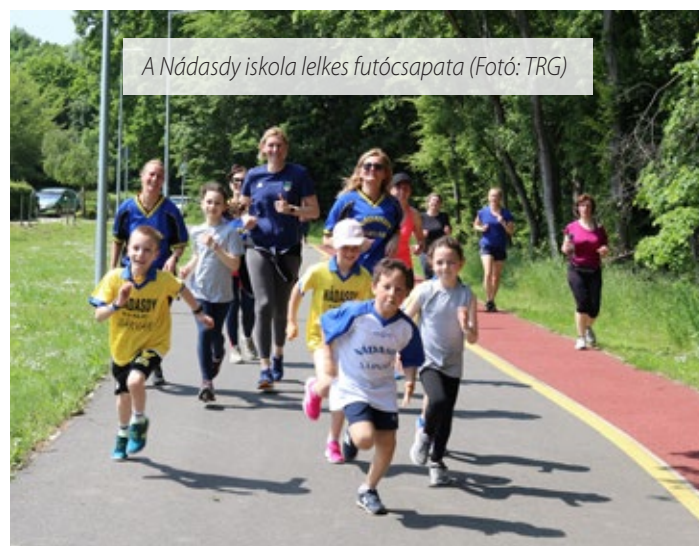
A Nádasy iskola lelkes futócsapata

Sárvár 2023-ban a képzeletbeli dobogó harmadik fokára állhat fel a Futókörök Napja versenyében, melyen országosan 25 település vett részt.