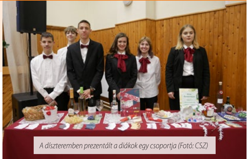
A díszteremben prezentált a diákok egy csoportja

A Sárvári Turisztikai Technikum Nyitott kapuk címmel projektnapot szervezett a 10. évfolyamos tanulói számára. A rendezvényen a turizmus-vendéglátás szakmacsoportban tanuló diákok az ágazati vizsgára való felkészülés részeként bemutathatták eddig megszerzett tudásukat.