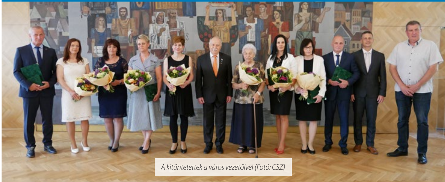
A kitüntetettek a város vezetőivel