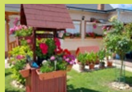
Óvár u. 5. – Véghné Németh Csilla