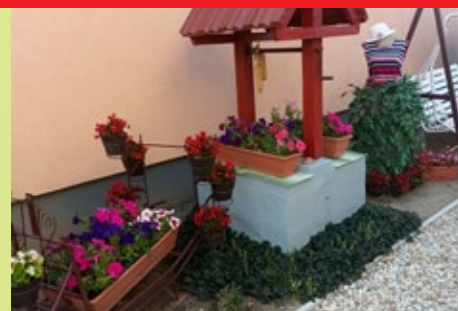
III. Világos u. 20. – Judit Masszázs – Nagy Judit