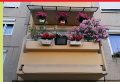
III. Laktanya u. 4. – Puklér Győzőné