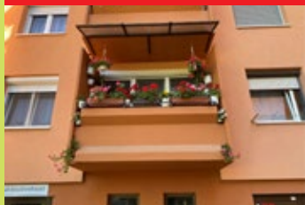
Petőfi u. 28. fsz. 2. – Fehér Istvánné