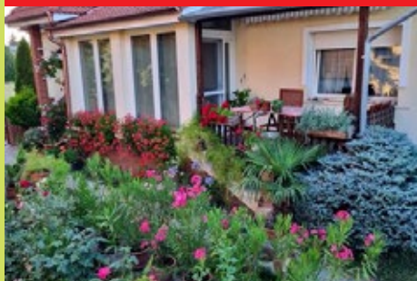
I. Ungvár u. 5. – Czegléd László, Czegléd Lászlóné