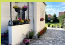
Csallóköz u. 17. – Szele Gergő