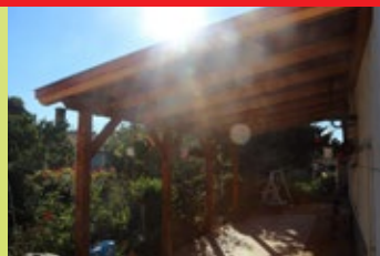
Nádasdy u. 100. – Bíró Nándor, Bíró Nándorné, Bíró Csilla, Bíró Ágnes