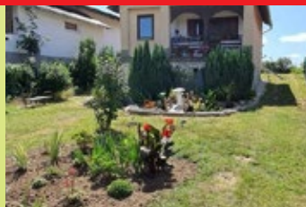
Celli út 43. – Pócza Imre, Pócza Imréné