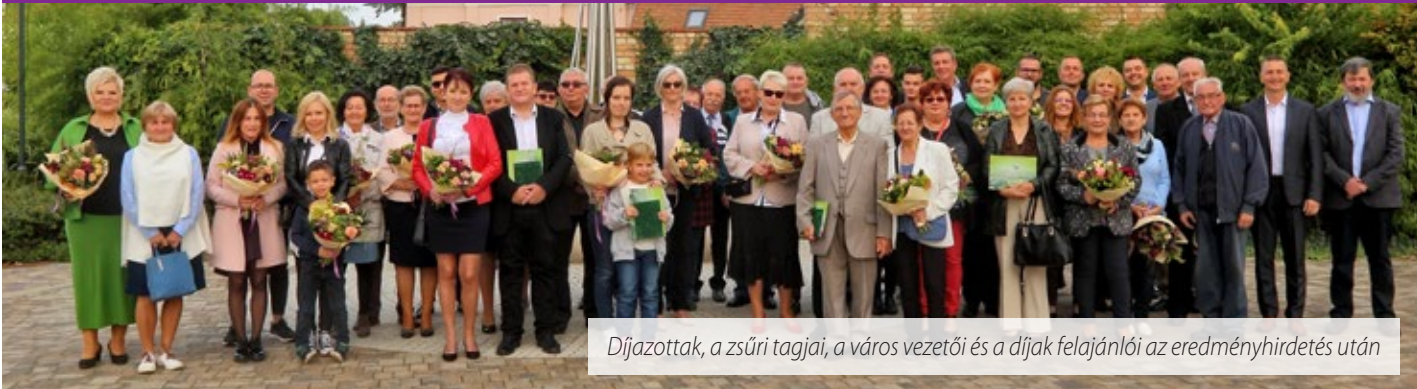
Díjazottak, a zsűri tagjai, a város vezetői és a díjak felajánlói az eredményhirdetés után

Szeptember 24-én került megrendezésre a Virágos Sárváért! Környezetszépítő Verseny eredményhirdetése a Hild parkban. A versenyt immáron 12. alkalommal hirdette meg Sárvár Város Önkormányzata. Az idei évben is díjazták a legvirágosabb vállalkozásokat, erkélyeket és házakat.