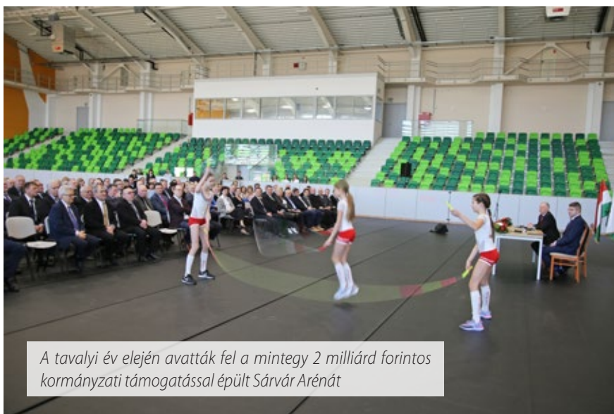
A tavalyi év elején avatták fel a mintegy 2 milliárd forintos kormányzati támogatással épült Sárvár Arénát

mos infrastrukturális beruházásról tudok még beszámolni, hiszen tavaly adtuk át a hegyközségi kerékpárutat, kormányzati támogatással felújítottuk a Vörösmarty és az Uzsoki utcákat, hamarosan kezdődik az Eperjes utca korszerűsítése is. Egy 100 millió forintos útfelújítási programot hajtottunk végre, egyirányúsítottuk a Várkerületet, több utcába fekvőrendőrkötő telepítettünk, továbbá elkezdődött a városi csapadékcatorna-rendszer tisztítása. A tervek elkészültek újabb parkolók építésére is, erre azon-