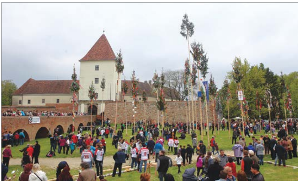
Májusfákkal és étellel telt meg május 1-jén délre a várpark

Május 1-jén délre ismét májusfaligetté változott a várpark, 36 fa magasodott a vár alakját mintázva. Közel ezer ember gyűlt össze, hogy együtt ünnepeljen, önfeláldozóan ezen a délelőttön.