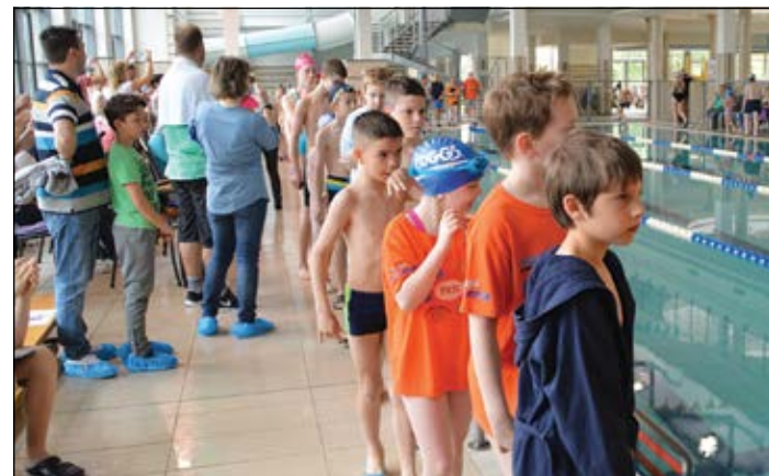
Az úszók 25 és 50 méteres távokon versenyeztek mell-, gyors- és hátúszásban

Korán reggel már a városi uszodában is nagy volt a készülődés. A városi sportnap keretében a Sárvári Úszóiskola szervezett