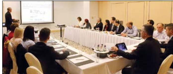
Német-magyar turisztikai tanácskozás a Spirit Hotelben

kötött együttműködési megállapodás értelmében Sárvárt és Büköt is népszerűsítették nyomtatott katalógusban, melyekből több ezret vittek el német utazási irodákba és turisztikai vásárookra.