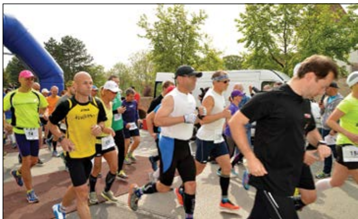
Az extrém időjárási körülmények próbára tették a 12-24 órás futóverseny résztvevőit

– Nagyon sok olyan akció van a városban, ahol demonstratív jelleggel megjelenek a kollégáimmal. Mindig szimbolikus jelentőséget tulajdonítok annak, hogy nem elég valamiről beszélni, hanem ha az ember ott van, akkor megpróbálja azt is megmutatni, hogy ő a saját korosztályában képes is és hajlandó is ezekben a