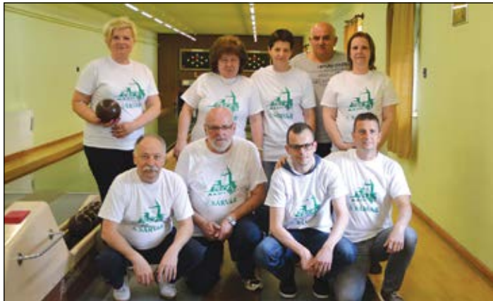
Az önkormányzati hivatal és a képviselő-testület csapatai idén is összemérték teketudásukat

A Sárvári Hagyományörző és Íjász Egyesület szervezésében a lelkes amatőrök a várudva-