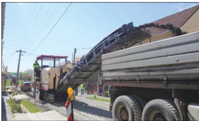
A Tomori Pál utcában a terra-mixes technológiával újítják fel az útburkolatot

pott a temetőbe vezető út, és leaszfaltozták a temető melletti parkolót is, amely összességében mintegy 11 millió forintba került. A Pap közben felújított-