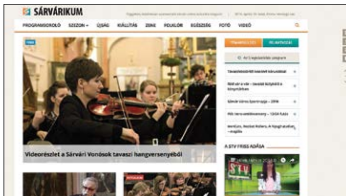
2016. április 26-án elindult a Sárvarikum