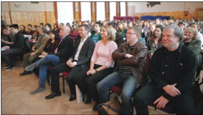
A Tinódi gimnázium dísztermében tartott gálát sokan megtisztelték jelenlétükkel