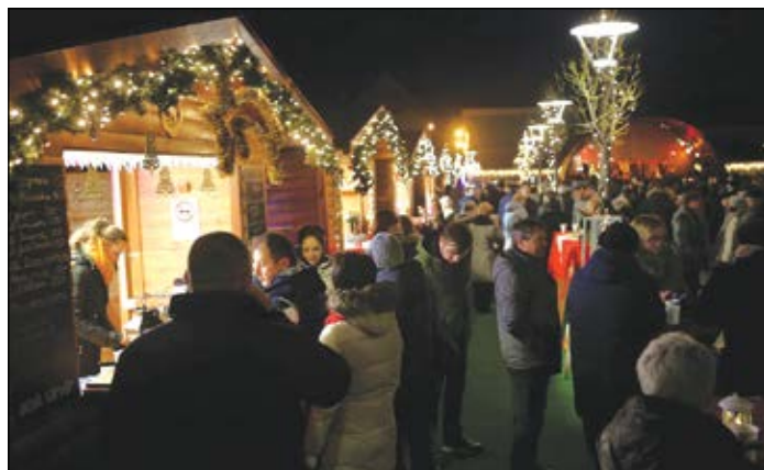
Az idei adventi vásárba is ezeket várják a Posta téren

prágai vásárán is részt vettek. Az őszi és a téli időszak sem telik el kampány nélkül, az iroda jelenleg a nemrég átadott M86-os utat promotálja, illetve a város imázs filmjeit terjeszti online felületeken. Újdonság, hogy a Sárvári TDM több más szervezet együttműködésével részt vesz a Mária-út népszerűsítésében is.