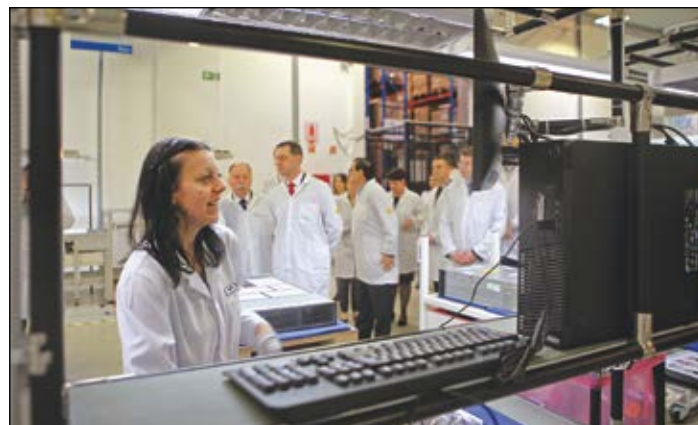
A Lenovo sárvári gyára 2016 decemberében fogja leszállítani a hatmilliomodik Lenovo asztali PC-t

Az informatikai szektorban megvalósuló beruházások kiemelten fontosak a magyarországi iparfejlesztés szempontjából – hangsúlyozta a nemzetgazdasági miniszter. Emlékeztetett rá, hogy az informatika az egyik leginnovatívabb, legnagyobb sebességgel fejlődő iparág, amely 2015-ben 400 ezer embernek biztosított munkát Magyarországon. A Nem-