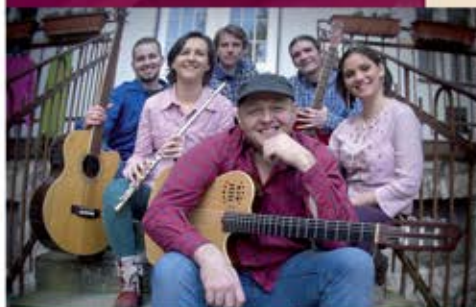
2016. NOVEMBER 27

* A Sárvári Koncertfúvószenekar kamaragyűjtése