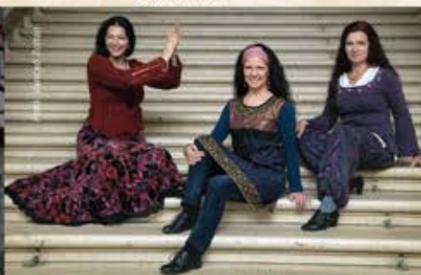
2016. DECEMBER 4