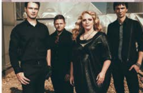
2016. DECEMBER 18