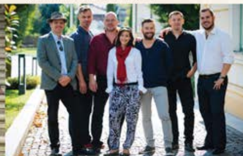
2016. DECEMBER 11