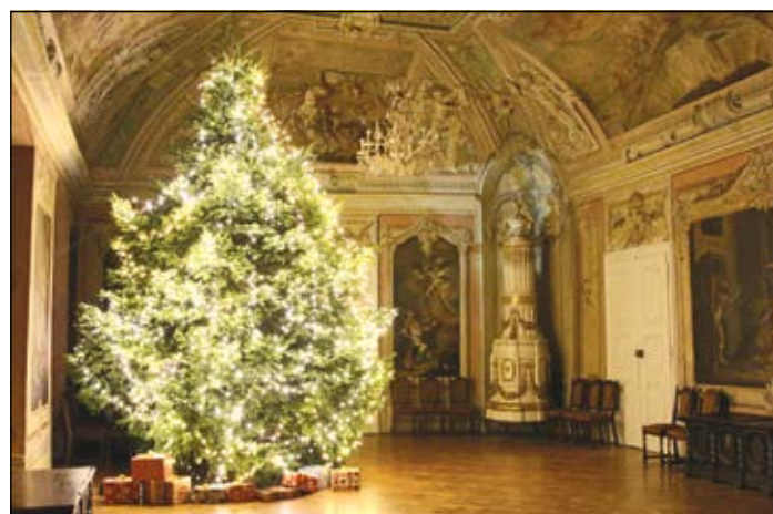
Advent a múzeumban

múzeum ugyanis úgy döntött, hogy a város több mint félezer ovisát elhívja, hogy segítsenek gyönyörűvé varázsolni az év