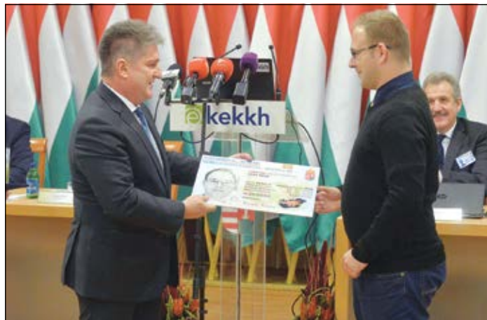
Az első elektronikus személyi igazolványt Tasnádi László, a Belügyminisztérium rendészeti államtitkára adta át a Közigazgatási és Elektronikus Közszolgáltatások Központi Hivatalában

Az új igazolványok igénylésének első napjaiban nem volt nagyobb roham a sárvári okmányirodában. A járási hivatal munkatársai remélik, hogy a régi okmányok cseréjére mindenkinél csak azok érvényességének a lejáratakor kerül sor.