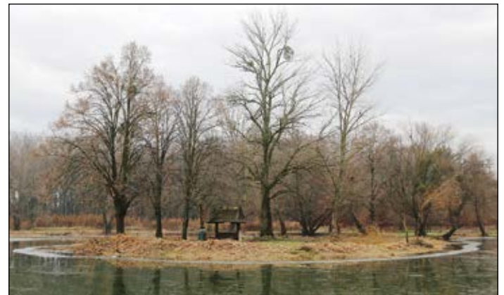
A sárvári horgászoké a város tórendszerének kezelői joga, cserébe a pecások vállalták a tavak és környékük karbantartását