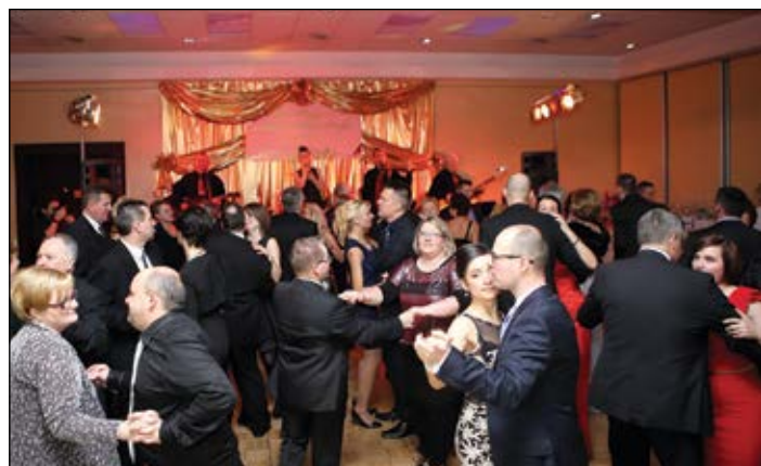
Sokszor kicsinek bizonyult a táncparkett a megyebál éjszakáján

Biztosítását weboldalunkon otthonából is megkérheti.