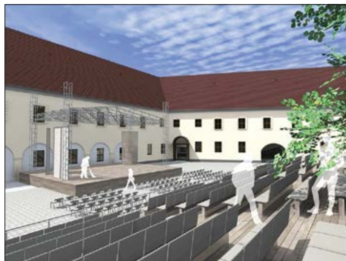
A Nemzeti Várprogram keretében a Nádasdy-vár udvarán megújulhat a színpad és a technika, valamint a nézőtér is

uniós és nemzeti pályázati forrásból az állam. A legeslegutolsó lépés, a vasútállomás épületének külső színezése kivételével megvalósult a beruházás. Ez most tavasszal fog megtörténni, mert ez pályázaton kívüli fejlesztés, és a MÁV saját forrásból, valamint a sárvári önkormányzat pénzügyi támogatásából valósítja meg. Három olyan fontos eleme volt, amely az utazóközönséget, illetve a sárvári polgárokat szolgálta, az egyik a kispostánál a körforgalom és a parkolók, a másik a vasút területén a kerékpártárolók és a parkolók, valamint az a kényelem, amely az utazóközönséget szolgálja ki: a váróterem, a tájékoztató