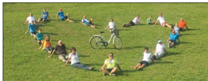
Szív alakú kerékpáros „flashmob” (Még több fotó: sarvaribringasok.hu)

tettük, és felidéztek történetét. Majd egy domboldali „flashmob”-bal kifejeztük, hogy a rendszeres testmozgás – így a kerékpározás is