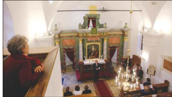
Az Ars Sacra hetében az érdeklődők az evangélikus templom felújításával is megismerkedhettek egy előadás keretében