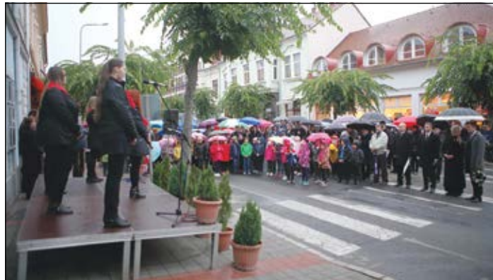
Az esős, borongós estén sokan eljöttek együtt emlékezni a nemzeti gyásznapon

Batthyány Lajos, aki a közelben lakott és a város országgyűlési képviselője volt. Rajta kívül ezen a napon, Desseffy Arisztidot, Lázár Vilmost, Kiss Ernót, Schweidel Józsefet, Aulich Lajost,