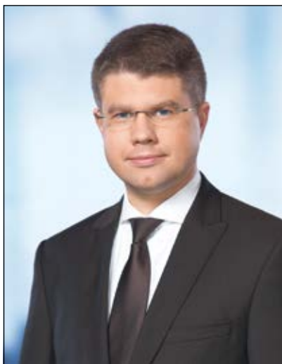
Ágh Péter országgyűlési képviselő leszögezte: az emberek egybehangzó akarata az volt, hogy ne legyen kényszerbetelepítés

csán fontos azt is megjegyezni, hogy 1990 óta még egyetlen párt vagy pártszövetség sem