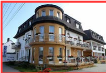
2. díj: AQUA Hotel - Fekete-híd utca 126. Lisztes István