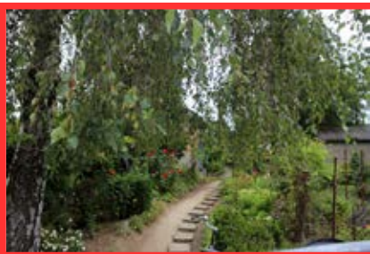
Tizenháromváros utca 26. Fekete Gizella és Fekete Mária