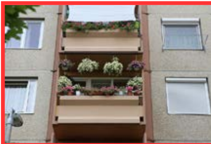
2. díj: Petőfi u. 28. II. emelet 6. Kéthelyi Imréné