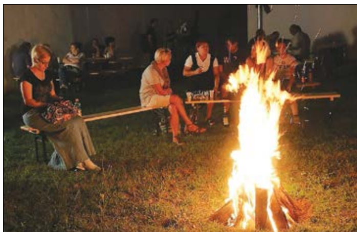
A közönség tábor-tűz mellett emlékezett a vasi rockzene meghatározó alakjaira