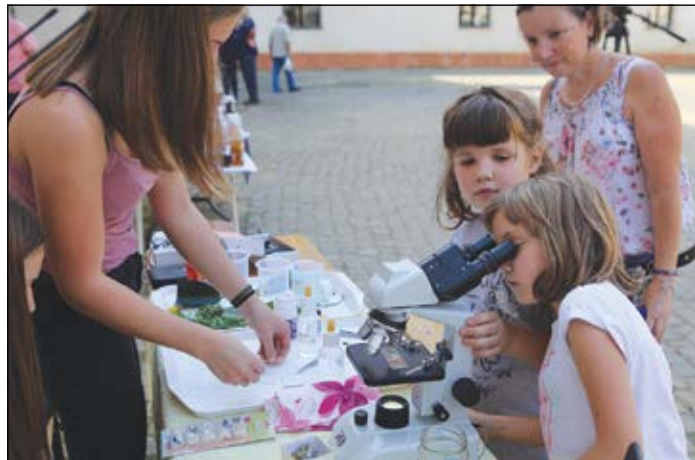
Ásványokat, növényeket, ízeltlábúakat vizsgálhattak a vállalkozó kedvűek a gimnazisták segítségével

előadásában. Továbbá ingyenes jógaórán és lovaskocsikázáson is részt vehettek az érdeklődők,