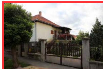
3. díj: Komárom utca 5. Németh Tivadar és Némethné Rádl Krisztina