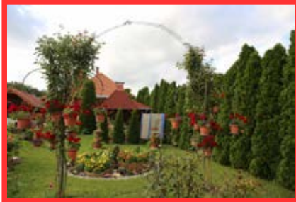
1. díj: Tilosalja utca 18. családi ház Lenkei Faragó Gyula és Nagy Imréné