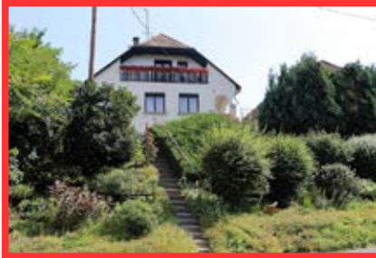
2. díj: Celli út 46. családi ház Tóth István és Tóth Istvánné