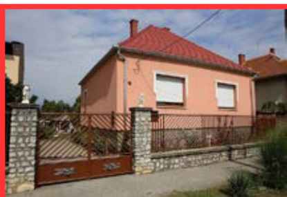
Szatmár utca 12. Mórocz Gábor és Mórocz Gáborné