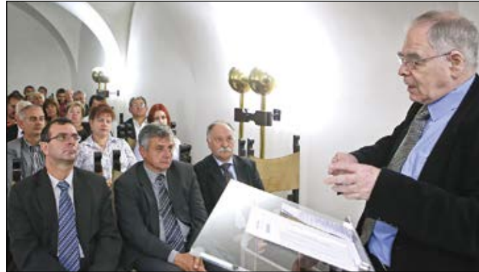
A betelepítés helyett a határok védelmére kell helyezni a hangsúlyt, és a problémákat ott megoldani, ahol kialakultak – hangsúlyozta dr. Schöpflin György a lakossági fórumon

azért is el kell utasítani a kötelező kvótát, mert az nem demokratikus. A népszavazás lényege, hogy a magyarok kifejezhetik migráció