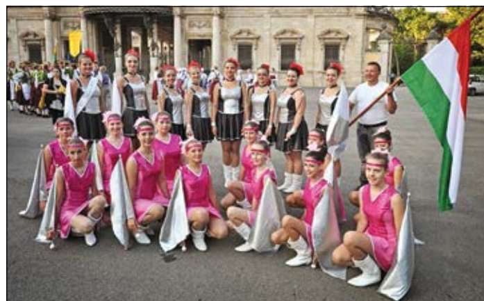
A sárvári mazsorettek az olaszországi összművészeti fesztiválon

Érkezésünkkor fáradtan, de annál lelkesebben pakolta ki mindenki csomagját a buszból,