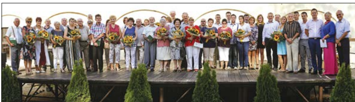
A Virágos Sárvárért verseny díjazottjai, támogatói és a zsűri tagjai a város vezetőivel

lyosan a lakosság városzépítő munkájának köszönhető. A másik köszönet pedig azt az összefogást illeti, amely keretében a turisztikai élet szereplői e mellé az ügy mellé állnak. A város szinte valamennyi nagy szállodája, civil szervezetek, a fürdő és más helyi szolgáltatók ajánlanak fel díjat a legvirágosabb ingatlanok