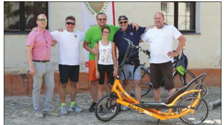
A Sárvári Kerékpár Egylet egy újfajta biciklivel, az ElliptiGO-val is megismertette az érdeklődőket

Az egyeslet folyamatosan programokat tervez, a kerékpártúrák mellett ősztől előadásokat, bemutatókat is szerveznek. Szeptember