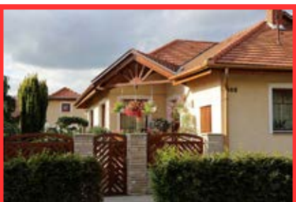
Nádasdy utca 105. Tomba Lajos és Tomba Lajosné