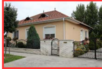
3. díj: Esze T. utca 42. családi ház Kiss Csaba és Kiss Csabáné