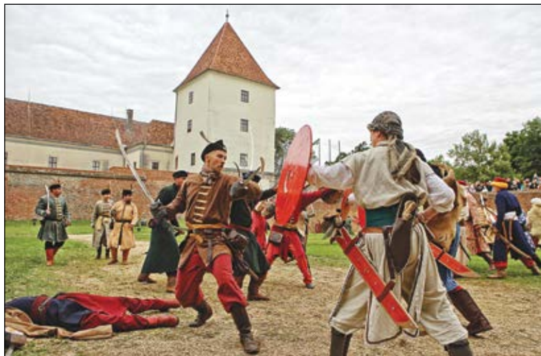
A leglátványosabb program idén is a magyar és az oszmán csapatok közötti összecsapás volt