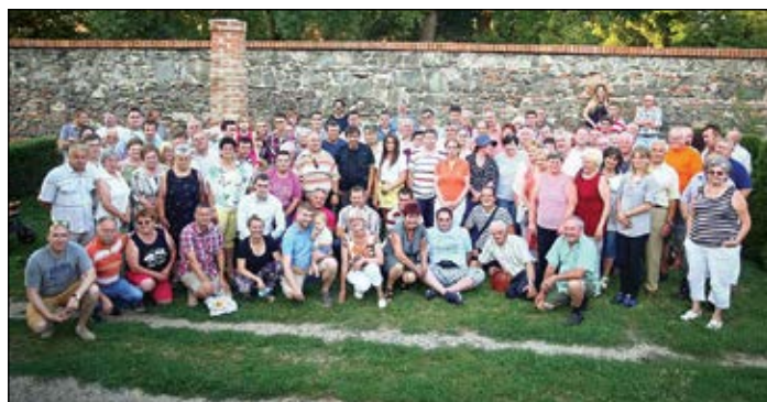
A Sárvári Polgári Piknik résztvevői