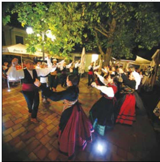
A spanyol együttes a Tinódi vendéglőben járta a táncot

egész nap programok várták az érdeklődőket, így nem volt üresjárat. Voltak viszont gyermekfoglalkozások, a fellépő csoportok pedig külön standokon is bemutatkozhattak. A felvonulás menete a körforgalomtól indult, ezáltal lerövidült,