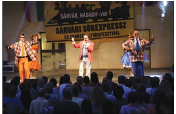
Fenyő Miklós koncertje fergeteges hangulatot és telt házat hozott a vár udvarára

– Eseménydús félév van a Sárvári Koncertfúvószenekar