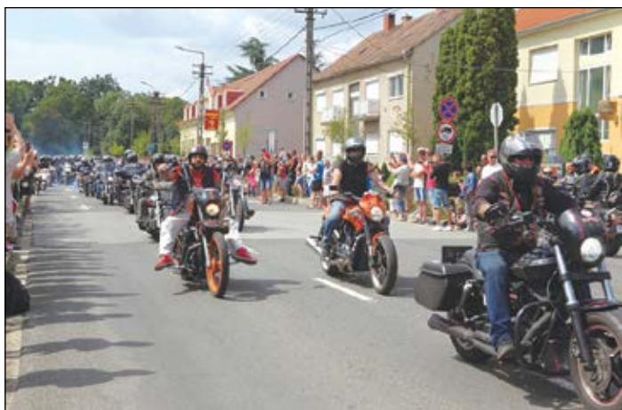
Több száz motor vonult fel idén is a város főutcáján