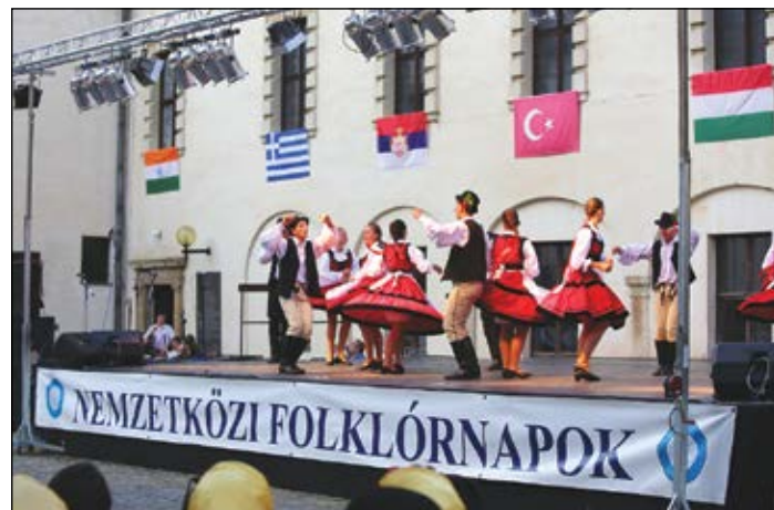
A csombordi Pipacs Néptáncszócsoporthoz mősora a vár színpadán