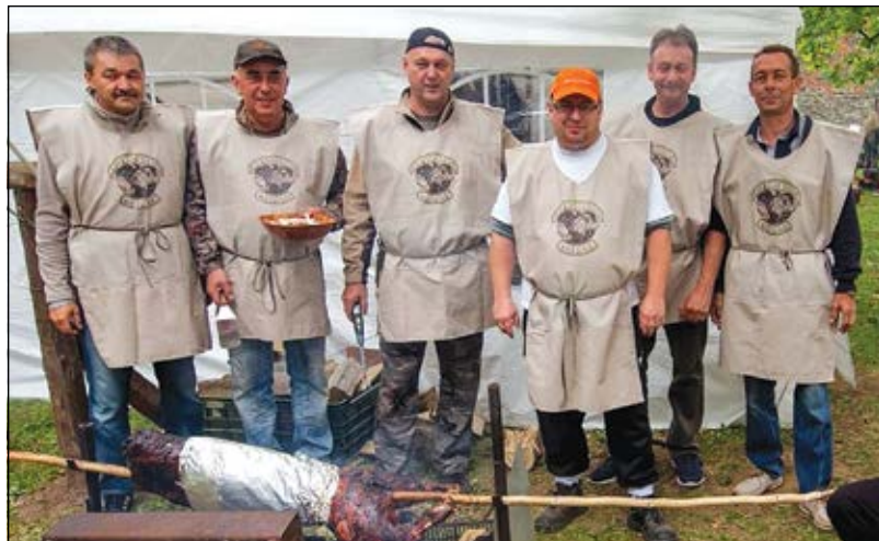
Az Országos Nádasdy Ételmustrán a legjobb ételsort a Vasi Vadkanok készítették

esti, nagyszínpadi fellépőket nem zavarta meg az időjárás, így nagy sikerű koncertet adott a Sugarloaf, valamint a Péterfy Bori és Love Band is. Az együttes sikere egyedi hangzásvilágának, energetikus dalainak és fellépéseinek, dalamos slágereinek köszönhető. A vasárnapi zárónapon a helyi együtteseké lett a színpad, előbb a Herpenyő zenekar muzsikált, majd a Regös együttes zenélt. Az égiek most nem voltak kegyesek a szervezőkhöz és a közönséghez, de úgy tűnik ez nem szegte kedvét a Nádasdy Történelmi Hagományörző Egyesület tagjainak, és jövőre