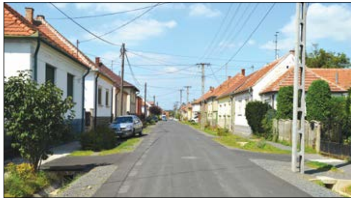
A Tomori Pál utca az idei évben kapott új burkolatot

sében érintett utcák felújítása, itt a terramixes technológiának köszönhetően teljesen új burkolatot kapott az út. A Mező utcában a járda felújítását, a csapadékvíz elvezetését oldották meg.