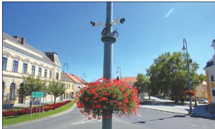
Közel negyven kamera vigyázza majd a városlakók és a turisták biztonságát

vány vagyona adta. Ez csak az első lépés volt, mert a jövőben