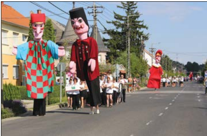
Óriásbábok kísérték a fürdőtől a várig a fúvósfesztivál résztvevőinek felvonulását