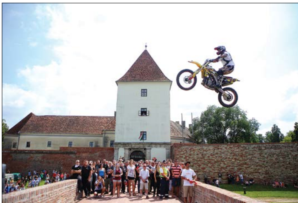
Repültek, szálltak a motorok, na meg a motorosok a Nádasdy-vár hídja fölött

15. alkalommal szervezték meg augusztus első hétvégéjén a Vármeetinget, a Nemzetközi Motoros és Rockfesztivált a vár falai között. A szervezők évekkal ezelőtt nyitottak már a város lakói felé, és ez jó döntésnek bizonyult. A motoros bemutatók, az esti koncertek nemcsak a motorosokat, de a sárváriak és a környékeliek ezreit vonzzák a rendezvényre.