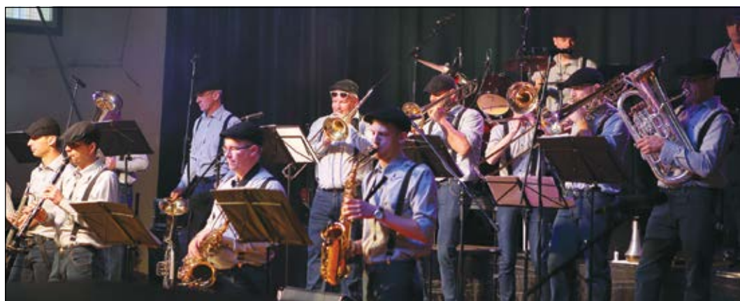
A Kanona Band közel húsz éve szórakoztatja a közönséget