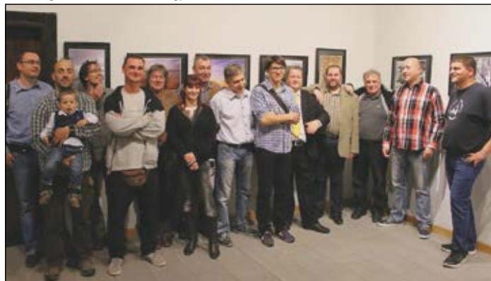
A Sárvári Fotóklub tagjai a köszegi kiállításnyitón

szöntötte. Az ANZIX című kiállítás megnyitóján közreműködött a Köszegi Vonósok két tagja.