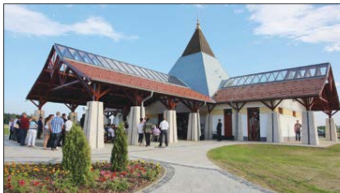
Fenséges és elegáns lett a ravatalozó

meg ünnepi beszédében, amelynek keretében a Habsburg-család tagjait temették el Bécsben, a