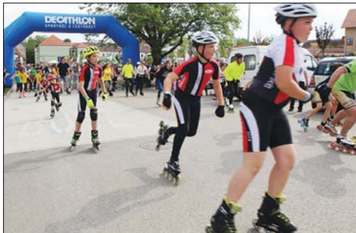
A görkorcsolyázók háromszor ezer métert tettek meg a kijelölt városi pályán