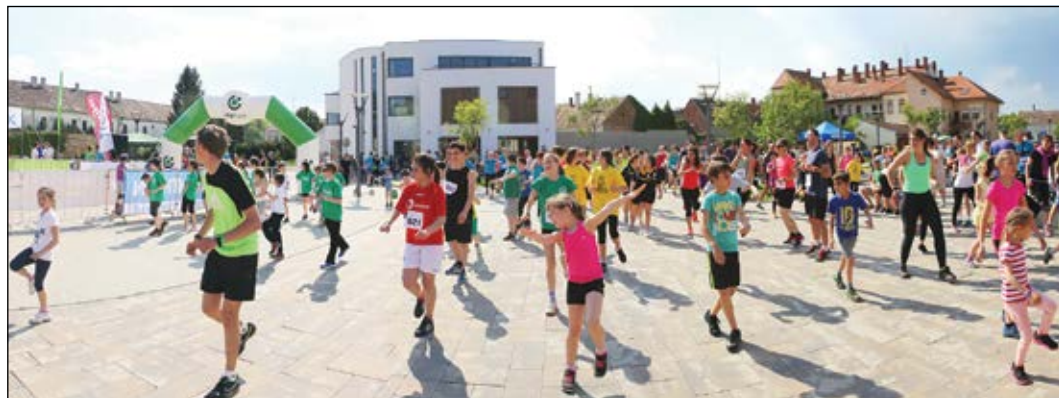
Örömsportolás helyszíne volt a Posta tér – kicsik és nagyok, amatőrök és profik együtt melegítettek be