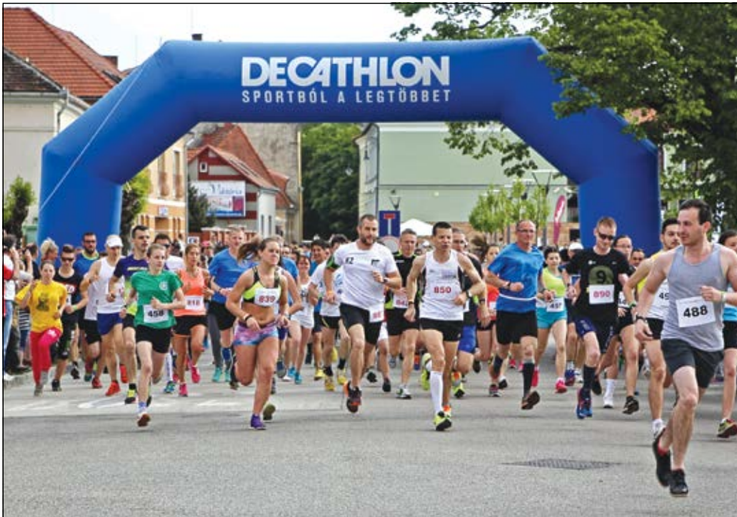
Több százan rajtoltak el a Posta térről – elől a profik, hátul a családi futam résztvevői

Igazi sportünnep helyszíné volt május 7-én a Posta tér! Több mint félezen rajtoltak el a IV. Flex Fut a Sárvár, Gurul a Sárvár futó- és görkorcsolya fesztivál keretében.