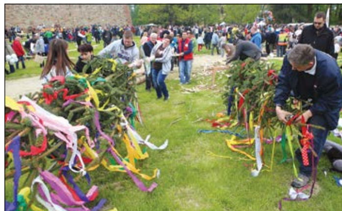
A Rábasömjénért Egyesület tagjai mellett a Sárvári Fotóklub fája is készül

alakzatát mintázva. Végül aztán egy harminchatodikat is sikerült felállítani egy sárvári család lelkesedésének és ügyességének