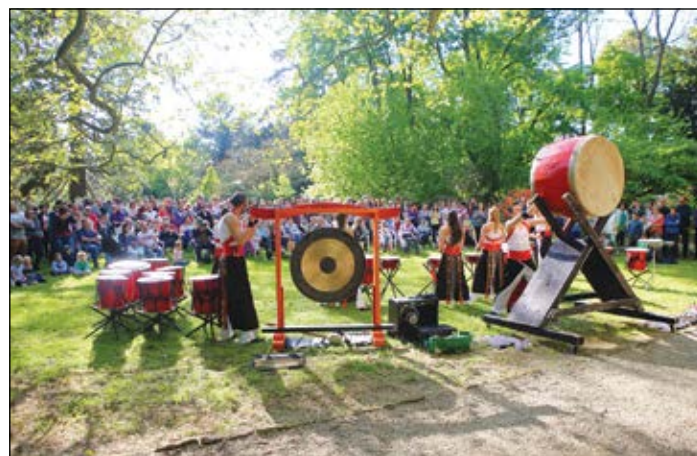
Ataru Taiko Japán Dobszínház

vezetésével. A testre, lélekre egyaránt ható energetikailag harmonizáló kezelés mindenki által megtanulható módszer.