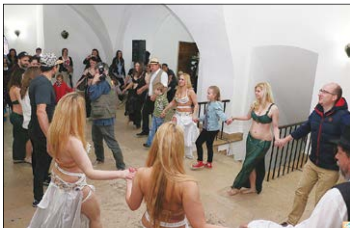
Össztánc a gálán