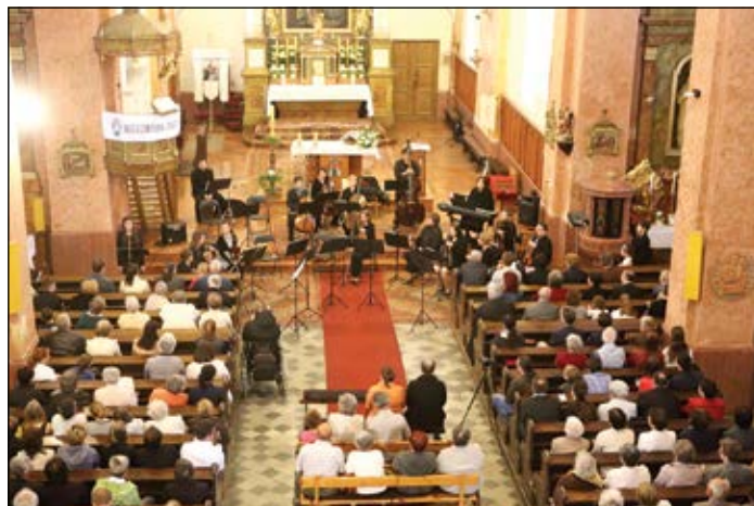
Megtöltötték az érdeklődők a katolikus templomot