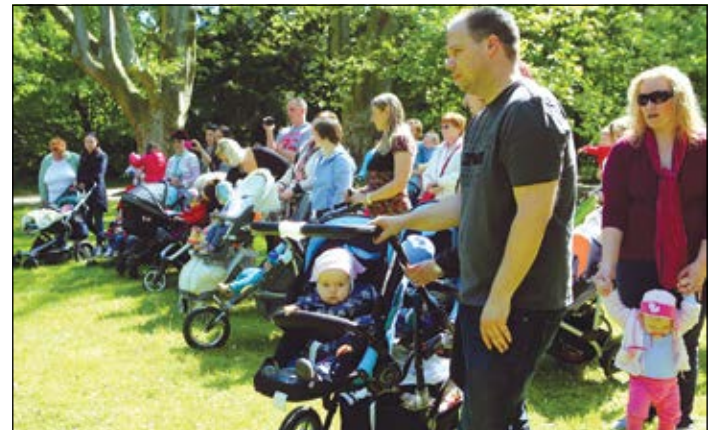
Sok szülő jött el, hogy elhelyezze gyermeke táblácskáját a születés fáján

Borovicsné Ferenczi Zsuzsannától, a népegészségügyi osztály munkatársától megtudtuk, hogy idén egy japán magnóliát ültettek el az apukák, erre kerültek fel a kisgyermek nevei. Ennek a fajfajtának a példányai az arborétum kertjének ékességei, a legidősebb példányok már 150 évesek.