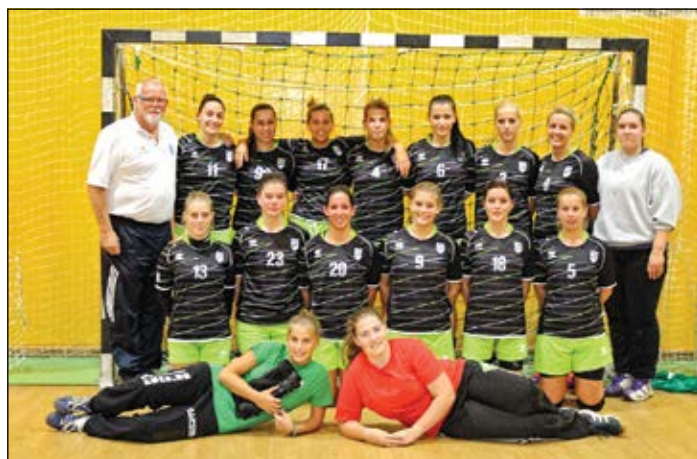
A nyolcadik helyen telelő kézisek javítani szeretnének a tavaszi szezonban