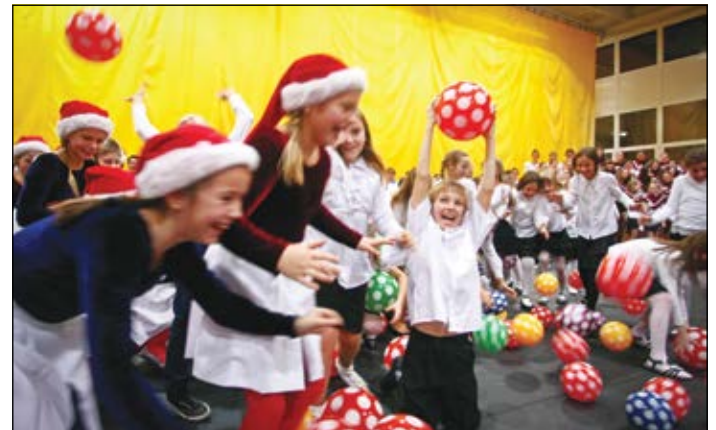
A Nádasdy iskola tornacsarnokának mennyezetéről aláhulló pöttyös labdákat óriási örömmel fogadták a gyerekek