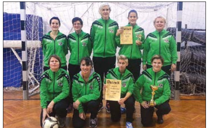
A sárvári Aranylábú Vastyúkok 1. helyezést érték el a sárvári kupán