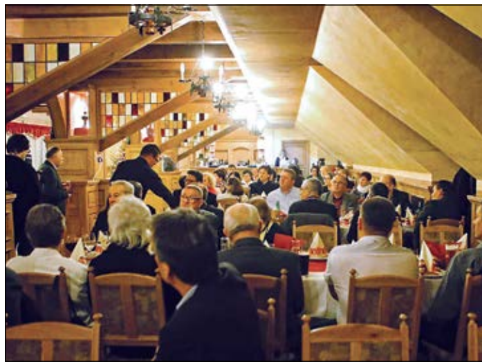
A Nádasdy Vendéglőben gyűltek össze évzáró vacsorára a helyi civil szervezetek vezetői

ugyanis az „ötszillagos város” a lélek, az élet, a teremtő erő, az