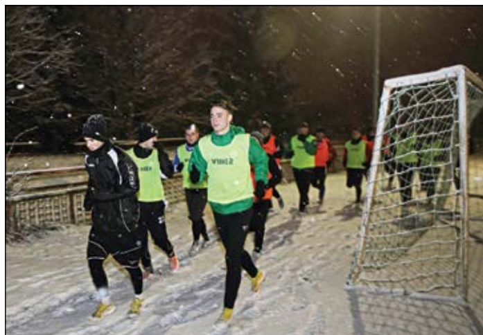
Labdarúgóinkat a havazás sem akadályozta a szabadtéri edzésben