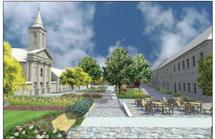
A tervek szerint a megyei fejlesztési keretből újjulhat meg a Hild park

gyarapodó magánberuházásairól is. Az év végére befejeződött a kivitelezése a hegyközségi új köztemetőnek is, amelyet a városrész csatornázásával együtt önerőből valósított meg az önkormányzat. A komplexum teljes kivitelezési költsége mintegy 522 millió forint volt. A beruházások felsorolásából nem maradt ki a