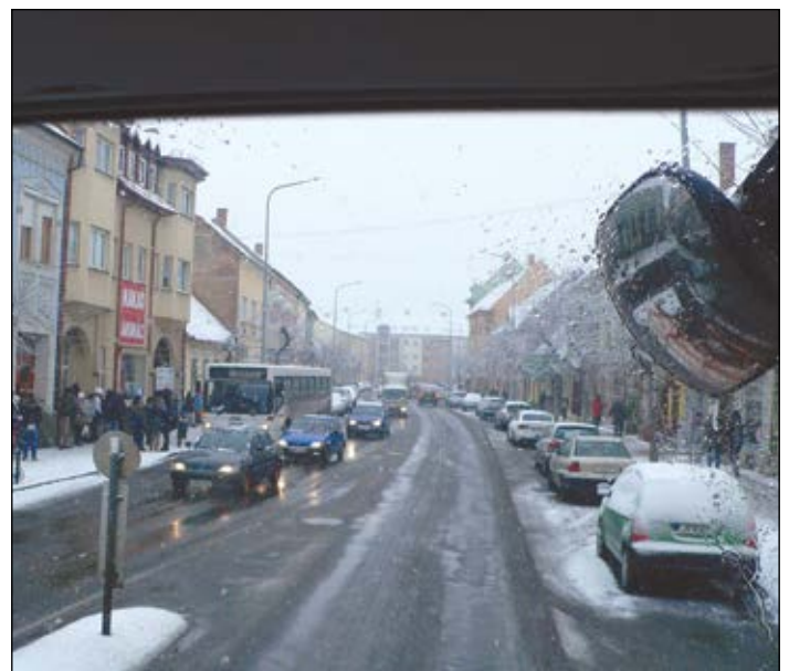
Az utak nagy részén csak nedvesítő anyag szórását kellett végezni

két órás ügyeleti műszakban látták el a munkájukat. Egyes útszakaszokon már megmaradt a hó, itt a tolólap is dolgozni kezdett, a többi részen a lefagyás megelőzésére nedvesítő anyag szórását és érdesítést végeztek. Sárvár útjainak és járdáinak hó- és csúszásmentesítéséről a tulajdonosoknak kell gondoskodniuk. Sárváron az önkormányzattal szerződéses viszonyban lévő munkagépekkel kezdték meg az utak tisztítását. A magánházak előtti út- és járdaszakaszok csúszásmentesítése pedig a birtokosok feladata.