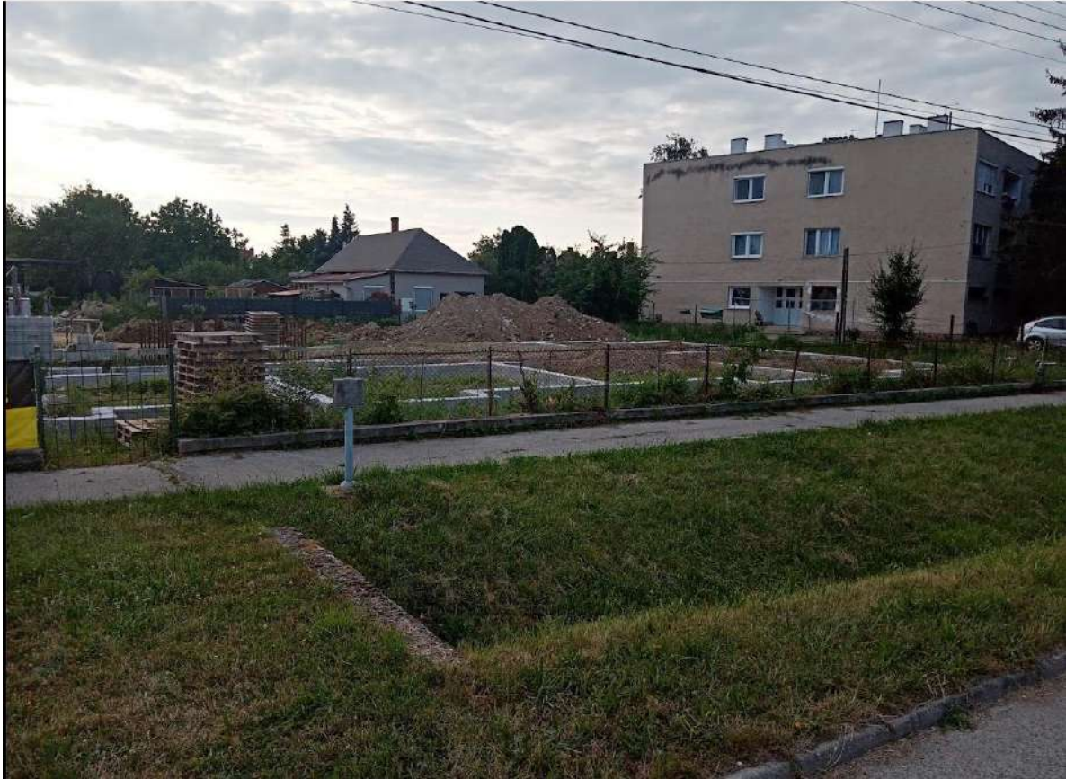
Az igénybe venni kívánt Sárvár 833/1 hrsz-ú kivett beépítetlen terület besorolású önkormányzati út